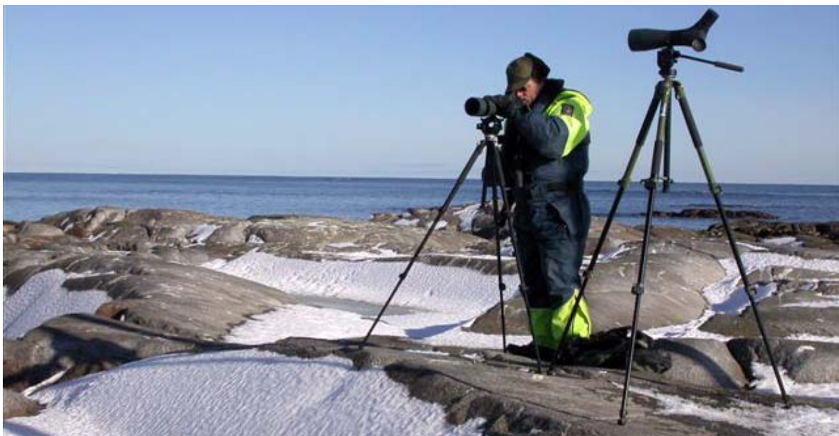
Feltoppgaver gjennomføres på bakgrunn av bestillinger som Fylkesmannen ønsker å få utført etter drøfting med SNO lokalt.

Avtale rapporteringsformer- og tidspunkt i forhold til de konkrete bestillingene.