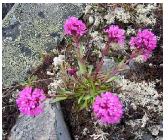
Viscaria alpina .

I utgangspunktet er det lagt opp til en bestillingsdialog og en samlerapport for hvert fylke. Der det er ønskelig med et annet opplegg kan dette avtales på bestillingsmøtene regionalt.