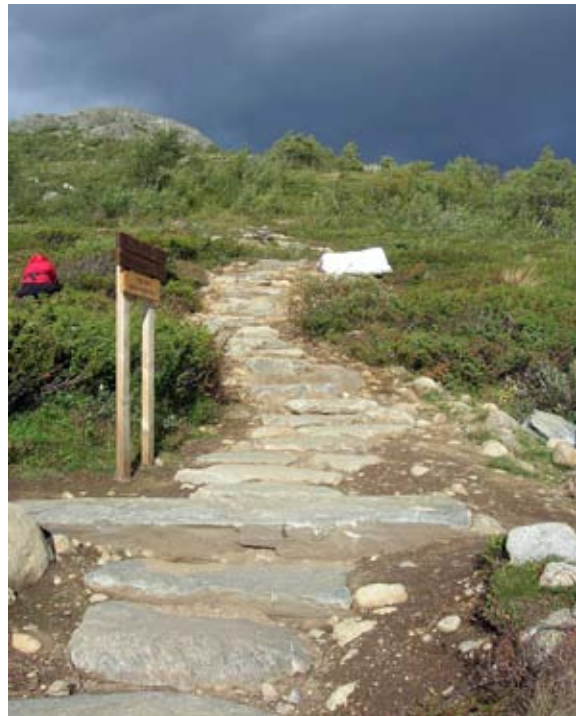
Stilrettelegging i Jotunheimen. Restaurering av erosjonsutsatt parti mellom Gjendesheim og Besseggen.

Kartlegging og overvåking av naturtilstanden, samt forekomst og bestandsutvikling av arter kan også være oppgaver for naturoppsynet. På lik linje med de øvrige oppgavene for verneområdene vil også disse inngå og planlegges gjennom bestillingsdialogen, med mindre det er nasjonale prosjekter som styres av sentrale forvaltningsmyndigheter.