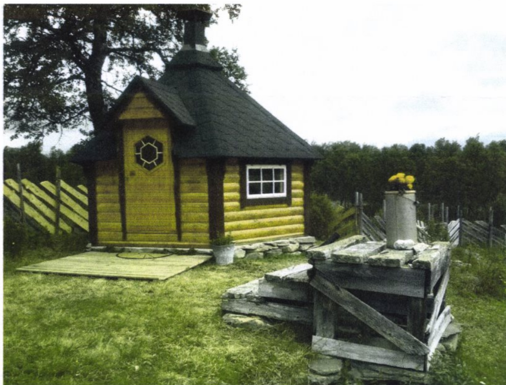
Grillhytta før demontering.

Grillhytta har stått på annen tomt i Os, er pr. nå demontert, og ønskes gjenoppført på bnr.250. Bnr.250 har tre eiere som er søsken. Når familien er samlet i korte perioder knyttet til ferie kan det bli mange personer på en gang som ønsker å bruke eiendommen. Grillhytta vil bedre eiendommens kapasitet i perioder med maksimal bruk.