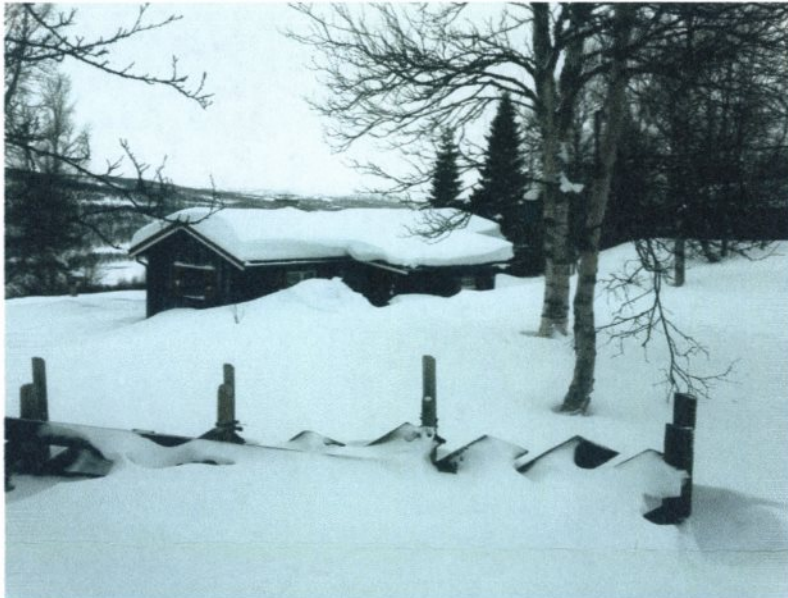
Hytta vinterstid, med Hanksjøen i bakgrunnen. Fra grinda i tomtas sørøstre hjørne. Relativt kraftig vegetasjon på og rundt tomta.