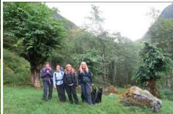
Lauveng i Avdalen, ein prioritert naturtype