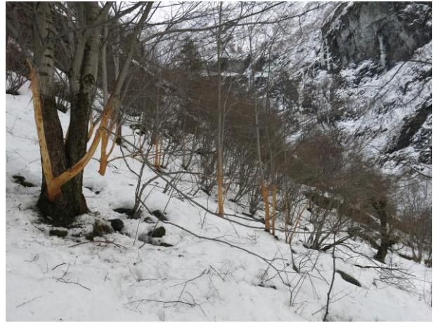
Sperregjerde ved Høgstulen før demontering Omfattande beiteskade på alm