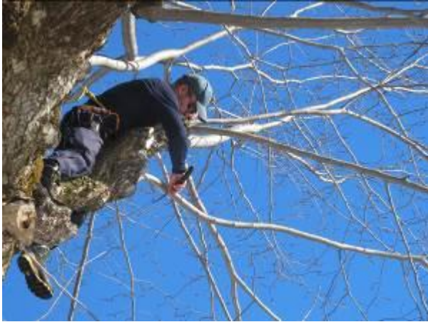
Rising av alm i Avdalen i mars