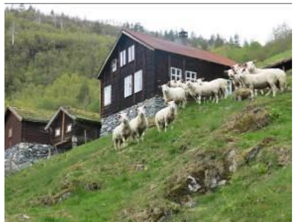
21 sauer på beite i Avdalen