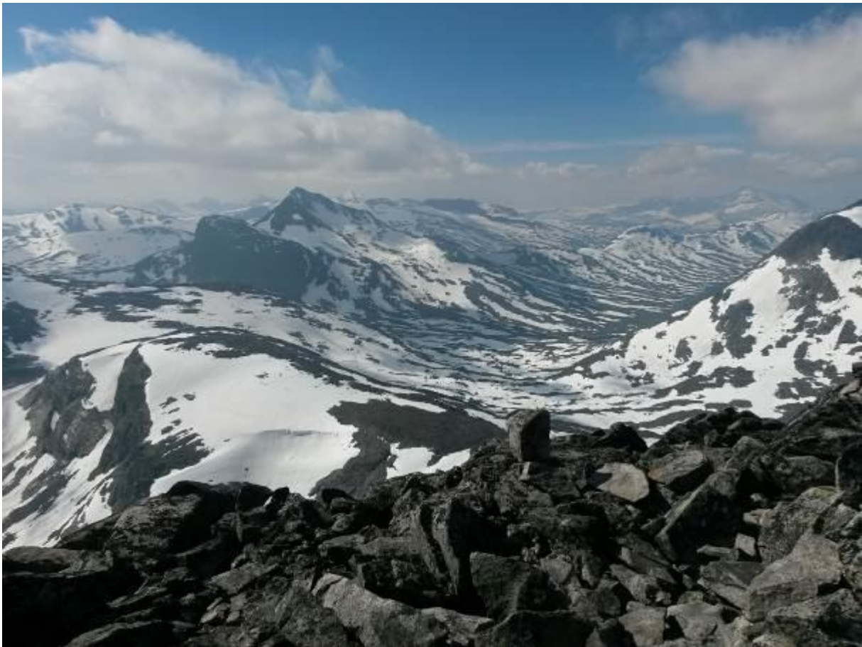
Utsyn frå Skardalstind 21. august