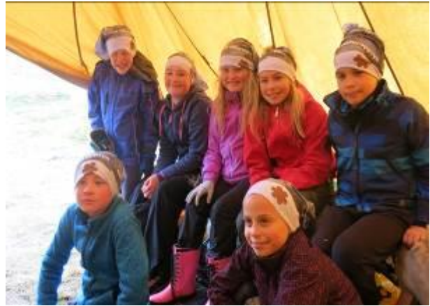
Barnas naturoppsyn frå Skjolden skule