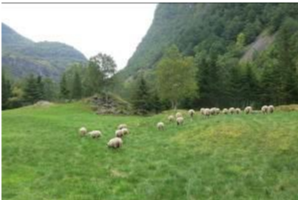
Sau på haustbeite ved Skåri i september