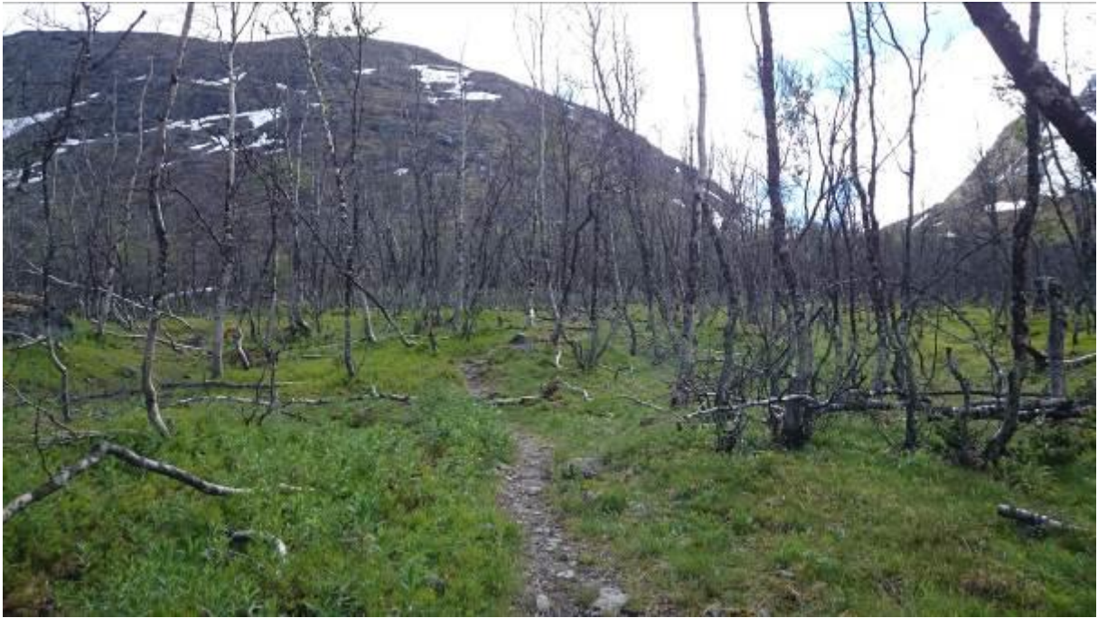
Lysopen bjørkeskog etter bjørkemålarangrep gjev gode grasbeite.