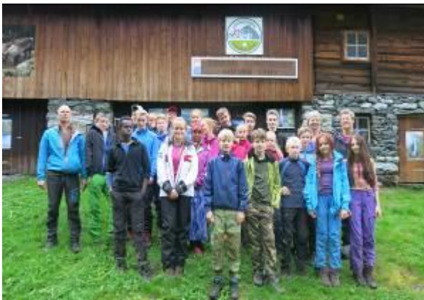
Lom ungdomsskule på sin årleg tur i Utladalen Med NRK og tsjekkisk gruppe oppe på Piggen