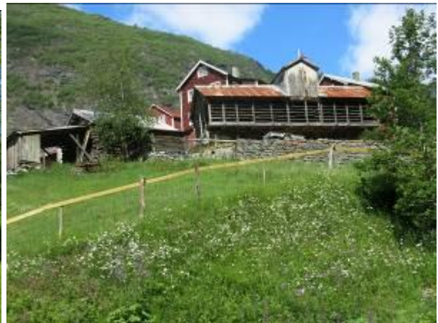
Blomstereng ved Vetti vart slått etter avblomstring i juli