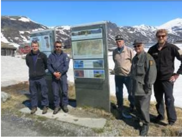
Ny infotavlene ved Eidsbugarden

Vidareføre produksjon og oppsetting av "roll-ups" ved turisthyttene i heile Jotunheimen. Vidareføre gode samarbeidstiltaka og utvikle nye når det gjeld naturvegledning. Ikkje minst gjeld dette «Barnas naturoppsyn».