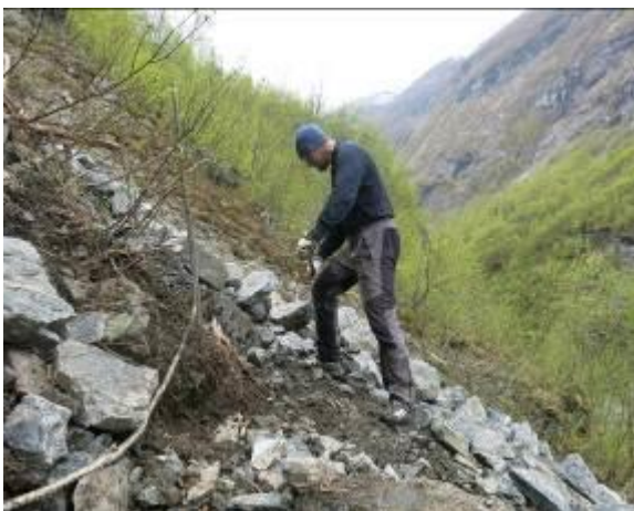
Vøling av stien inn til foten av Vettisfossen

Stien i øvre delen av Storutladalen bør vurderast lagt om til sørsida av dalen. Ein slepp da unna to bruer og terrenget er mykje meir tørrlendt.