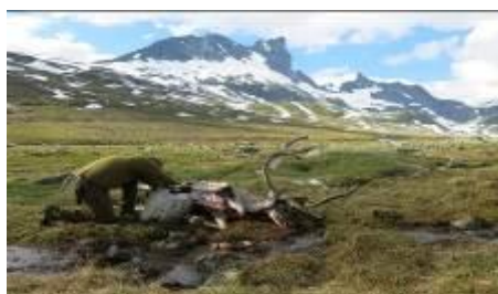
Villreinjakt i Gravidalen