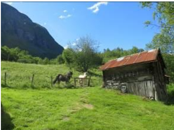
Hestar på beite ved Lauvhaugen