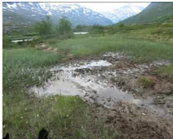
Våte myrparti langs stien i Storutladalen