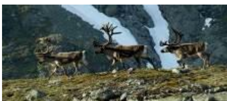
Villreinbukkar på Gravidalsbandet

Villrein og ferdsel er eit tema som bør følgjast opp. Spesielt gjeld dette i samband med dei store arrangementa i området Turtagrø/Fanaråken/Hurrungane og rundt opning av Tindevegen i månadsskiftet april/mai.