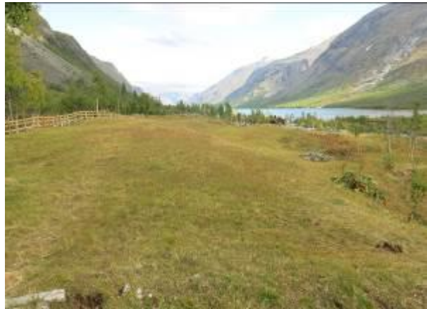
Kvea ved Gjendebu ved oppstart skjøtsel i 2004, og etter slått og beite i september 2015