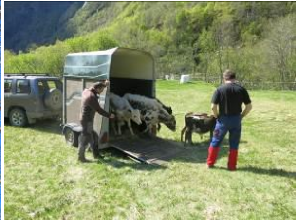
Okseslepp i Vetti 18. mai