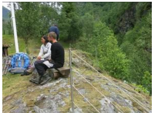
Sikringsgjerde ved Utladalen Naturhus på elvekanten mot Utle