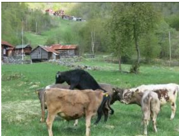
Oksekalfvane på beite ved Flaten