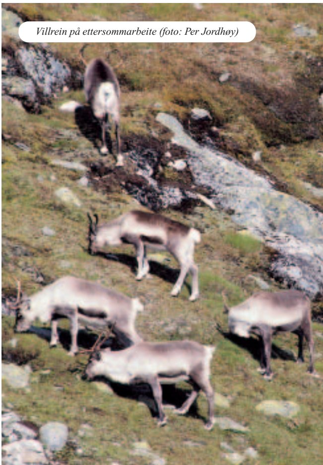
Villrein på ettersommarbeite

Ein nasjonalpark vil i større grad fokusere på at området er eitt av Noregs viktigaste villmarksområde med eit sårbart dyreliv. Dyrelivet vil dermed få eit sterkare vern mot forstyrring, noko som vil føre til ein streng dispen-