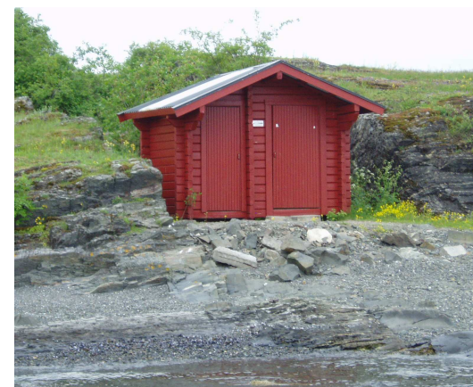
Døme på toalettbygg

Stor trafikk ved Billingen fører med seg en god del søppel og ekskrement frå folk. Dette gir eit lite hyggeleg bilde av området. Skjåk kommune har motteke fleire klager når det gjeld søppel og sanitærforhold i området. Problemet har oppstått etter opprettinga av Billingen som infopunkt. I sommar vart det sett opp ein søppelcontainer som ein midlertidig løysing. Vi ynskjer å etablere ein meir permanent løysing med etablering, ettersyn og vedlikehald av toalett og søppelcontainer.