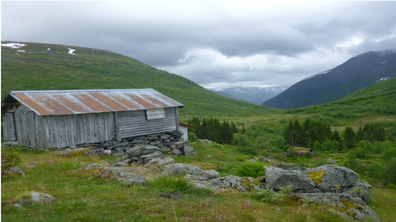
Figur 3 Stølshuset sett frå vest.