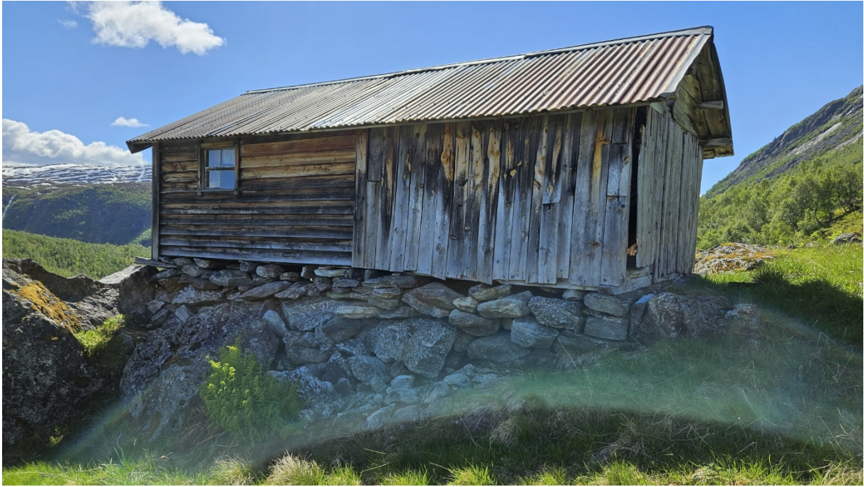
Figur 2 Stølshuset sett frå aust.