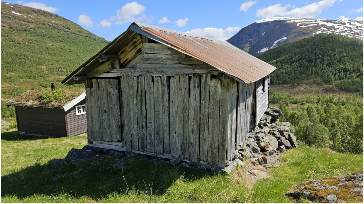
Figur 4 Stølshuset sett frå nord.