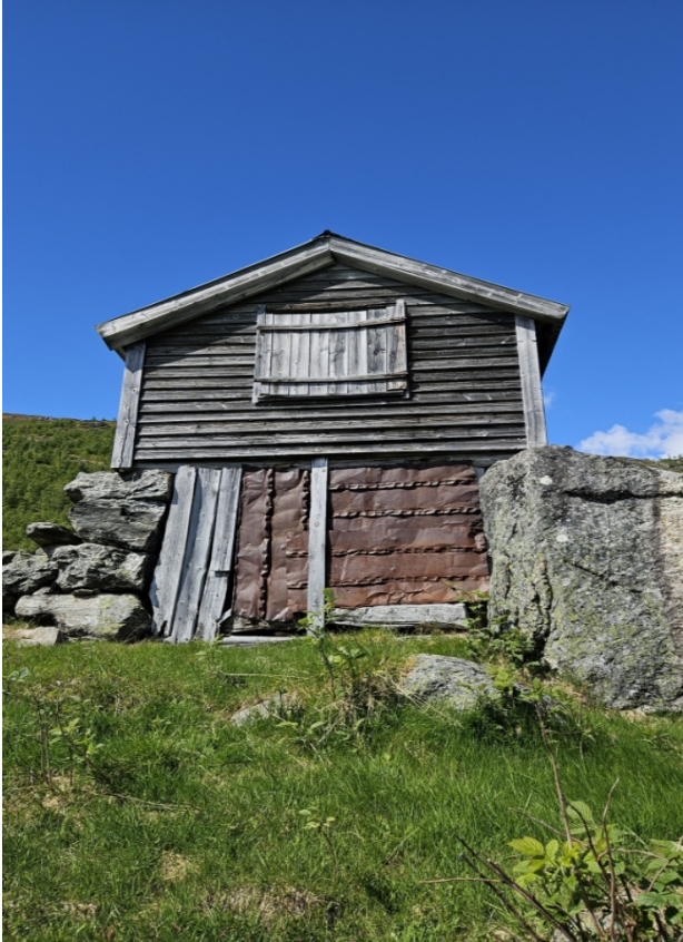
Figur 5 Stølshuset sett frå sør.