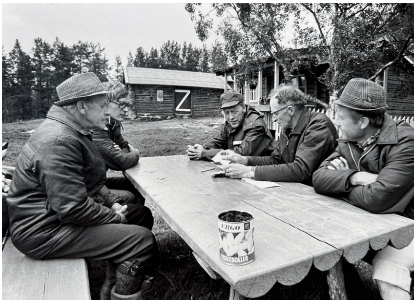
Daværende statsminister Odvar Nordli besøkte Haugen på syttitallet.