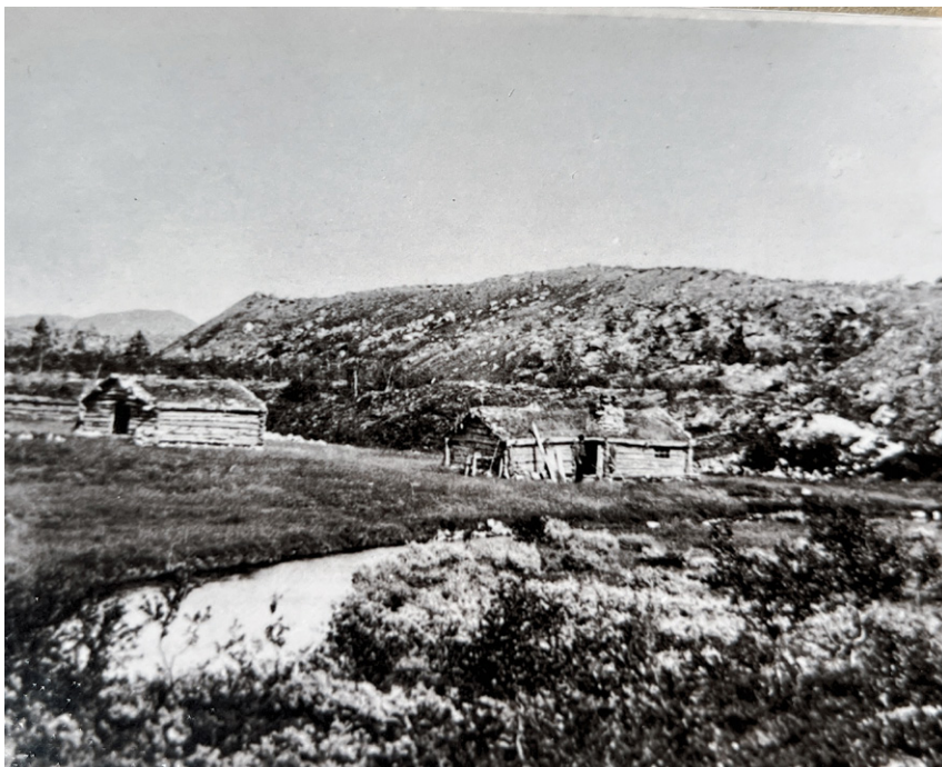
Ingen vet hvor gammel Grøtådalssetra er, men trolig har den vært seter for Femundshytten allerede på 1700-tallet.