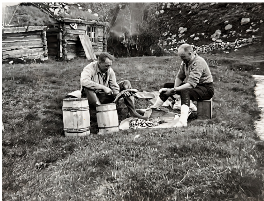
Fiskere på Grøtådalssetra.