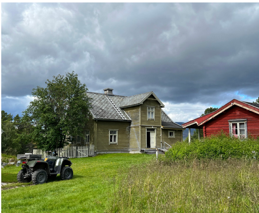
Hovedhuset på Haugen, Vinterstuggu, ble bygd i 1938.