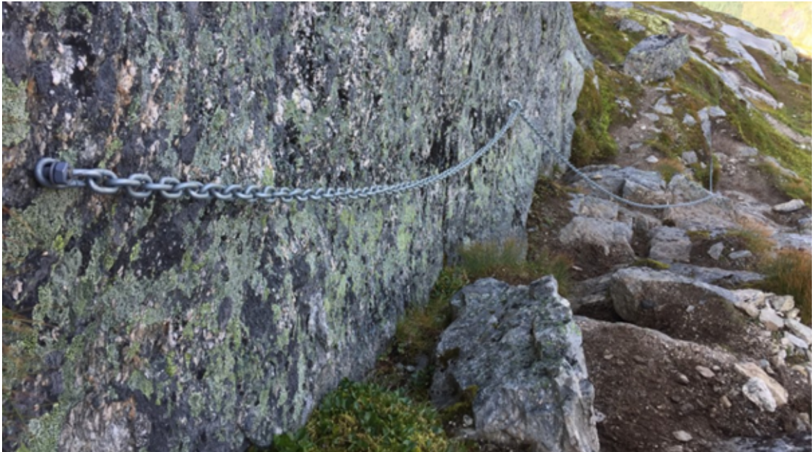
Figur 3 Viser sikringspunkt 1 (sjå figur 2). Kjettingen var sett opp utan løyve og er no tatt ned