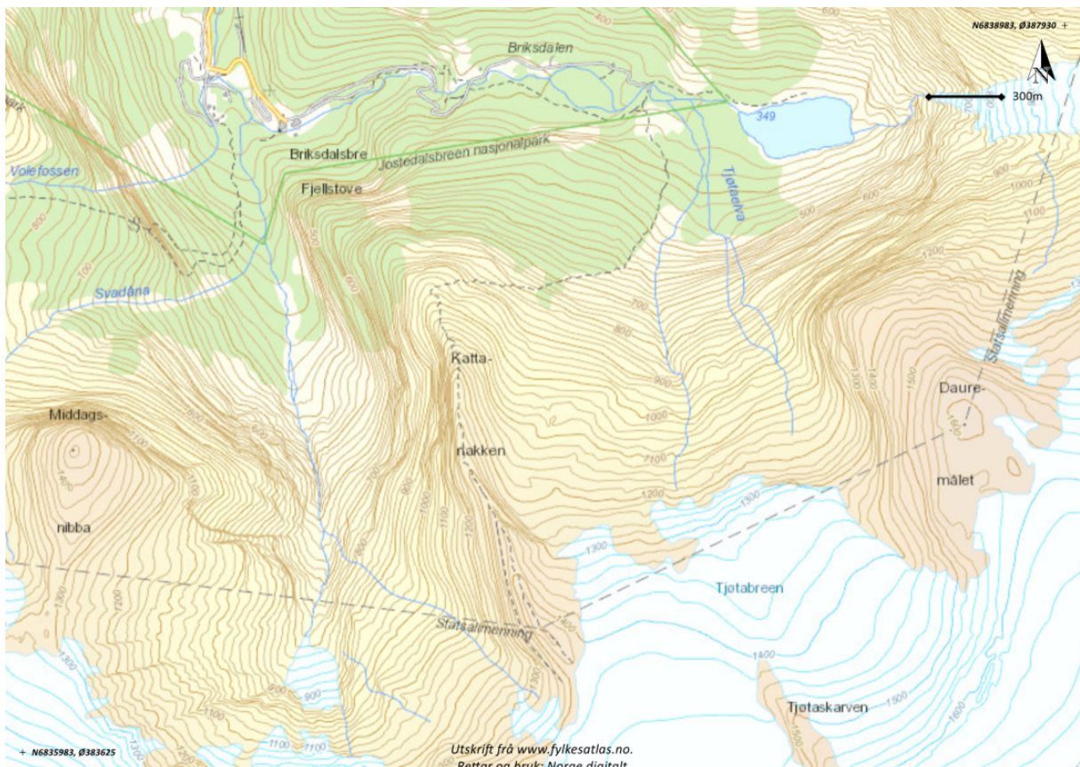
Figur 1 Oversiktskart Briksdalen og Kattanakken

Stien frå Briksdalen til Kattanakken er ein del av den tradisjonelle breovergangen frå Briksdalen om Kvitesteinsvarden og Austerdalsbreen til Tungestølen i Luster kommune. Denne breovergangen er dei seinare åra blitt vanskeleg på grunn av at Austerdalsbreen har minka mykje. Det har likevel vore sterkt aukande interesse på stien frå Briksdalen til Kattanakken, då som toptur utan å gå på bre.