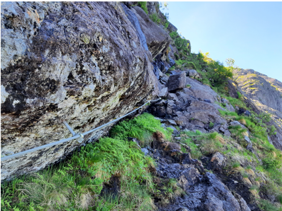
Figur 4 Illustrasjonsfoto som viser feste for wire med borebolt i fjell