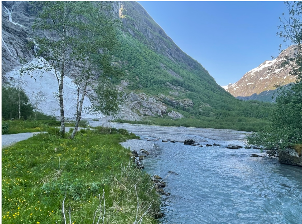
Figur 3 syner den regenererte breen i juni 2023.