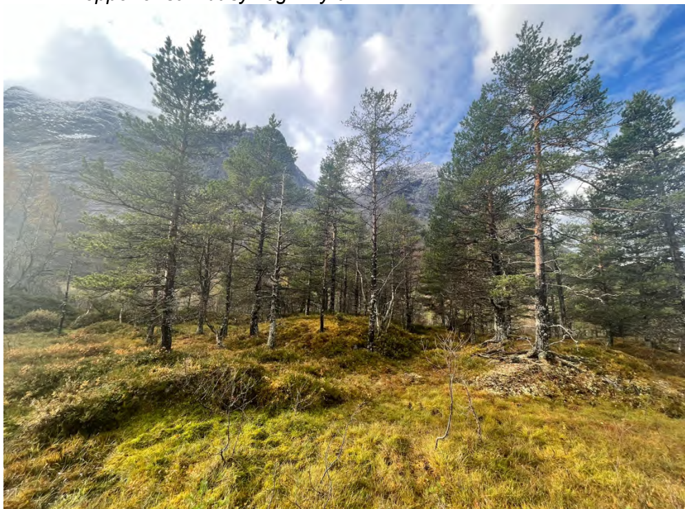
Fig. 3 Eit av områda med furuskog aktuelt for uttak av tre til kloppematerial.