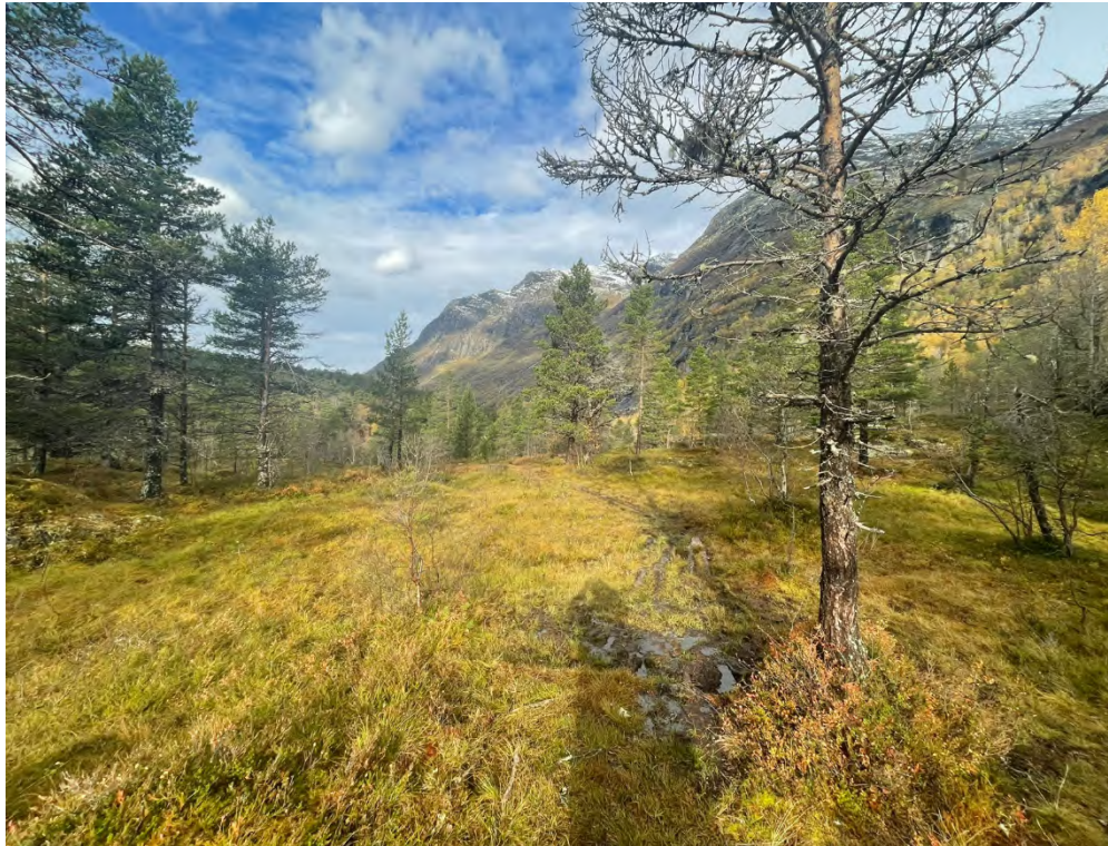
Fig. 2. Oversikt over myr med sti der klopplegging treng fornying. Gamle klopper er så vidt synleg i myra.