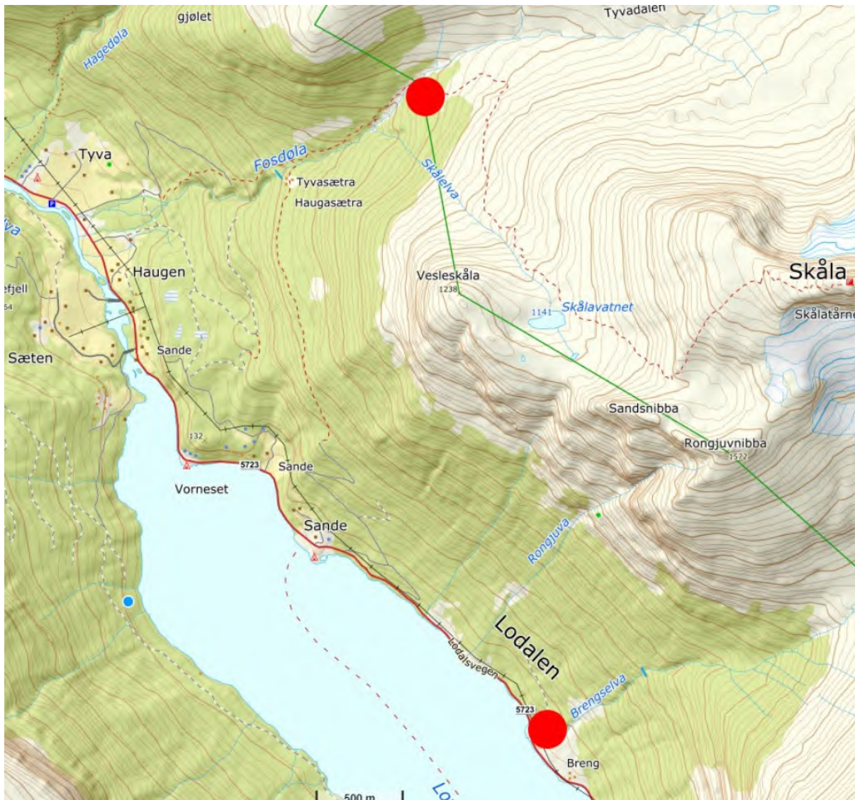
Figur 1 Kart som viser start- og endepunkt for flygingane. Henta frå søknaden.