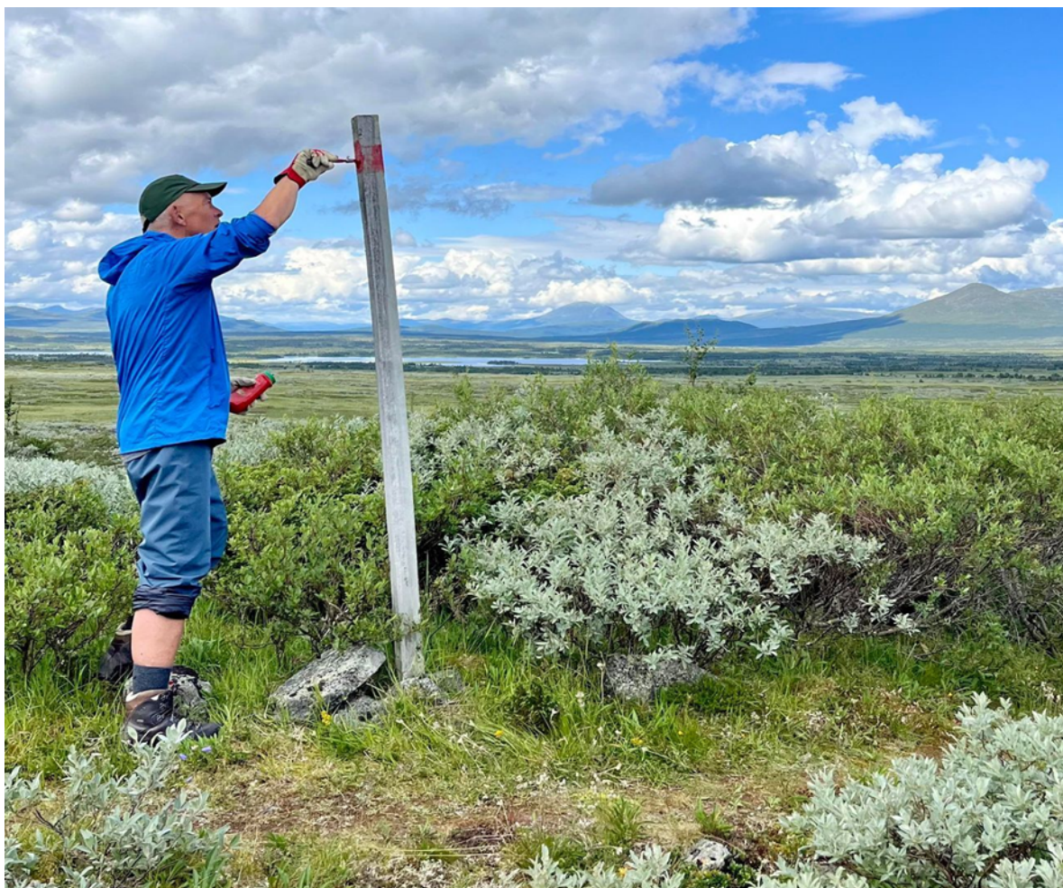
Eksempelbilde DNT, stimerking med stolpe.

Verneforskriften § 3 1.3 h angir at merking av nye stier er noe forvaltningsmyndigheten kan gi tillatelse til. I samme bestemmelse tolker forvalter også at nye metoder for merking av stier må inngå. Det innebærer at bruk av nye metoder for merking av stier skal behandles og vurderes av forvaltningsmyndigheten.