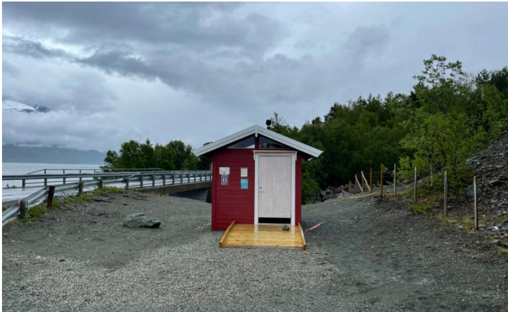
Toalettet i faueldalen

Etter befaringen ble det holdt et møte med utviklingslagene for Jøvik og Lakselvbukt.