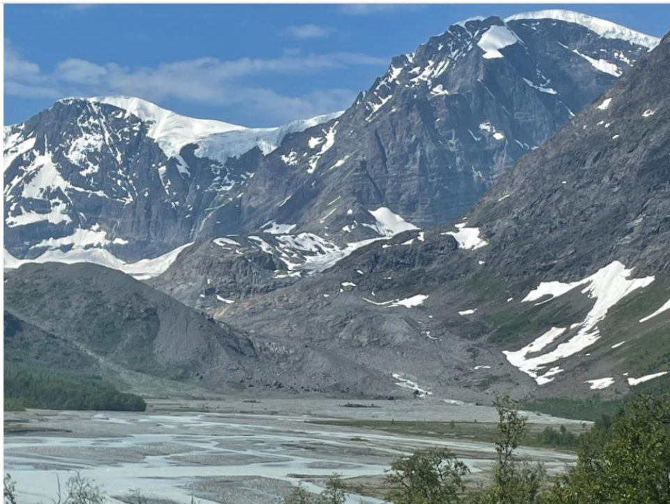
Dalbotn i Lyngsdalen