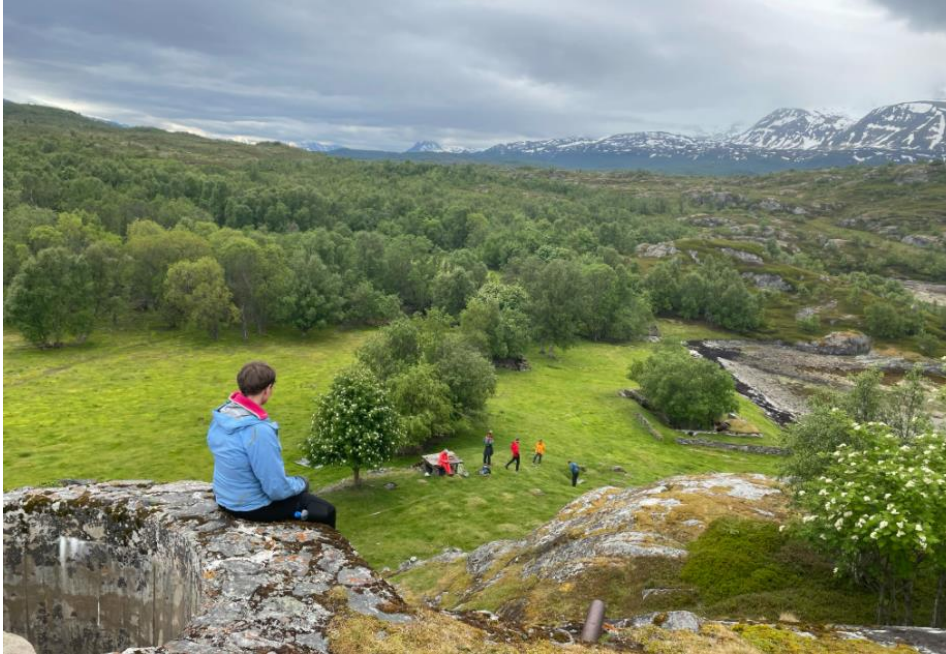
På Årøya med styret for Ishavskysten friluftsråd

Verneområdestyret for Lyngsalpan landskapsvernområde