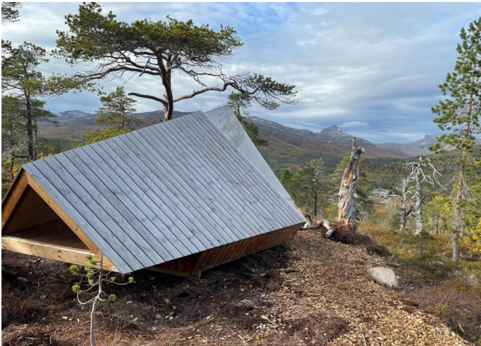
Utkikkspunkt i rundløypa som går på utsiden av parken. Herfra ser man langt inn i nasjonalparken.