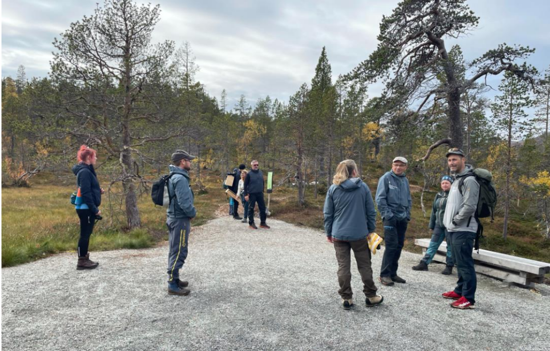
Lyngsalpan verneområdestyre ser på stiene i Ånderdalen.

Verneområdestyret for Lyngsalpan landskapsvernområde