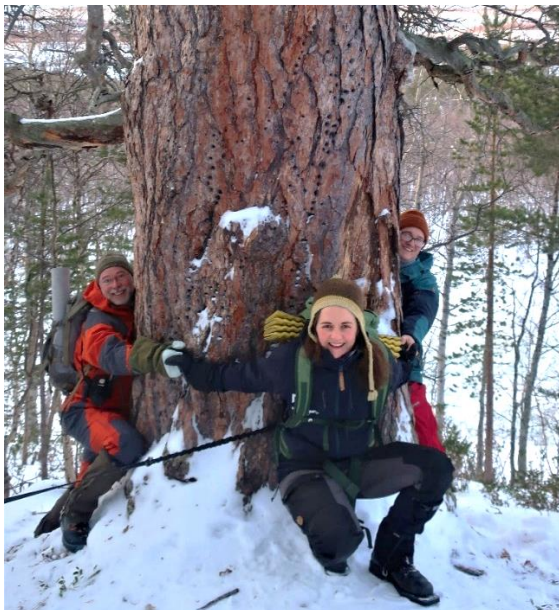
Bilde 5 Tre forvaltere trengs det til å holde rundt Dypendronninga.

Dypendronninga er den mest besøkte «attraksjonen» i Dypen naturreservat. Dypendronninga er en gammel furu som ruver i terrenget. Dette har vært et populært besøksmål for lokalbefolkninga i Saltdal, og mange gjester på Saltfjellet hotell har fått turen inn til Dypendronninga anbefalt. Furu døde i tidsrommet 2017-2020 men står fortsatt og vil være en attraksjon ennå i noen desennier.