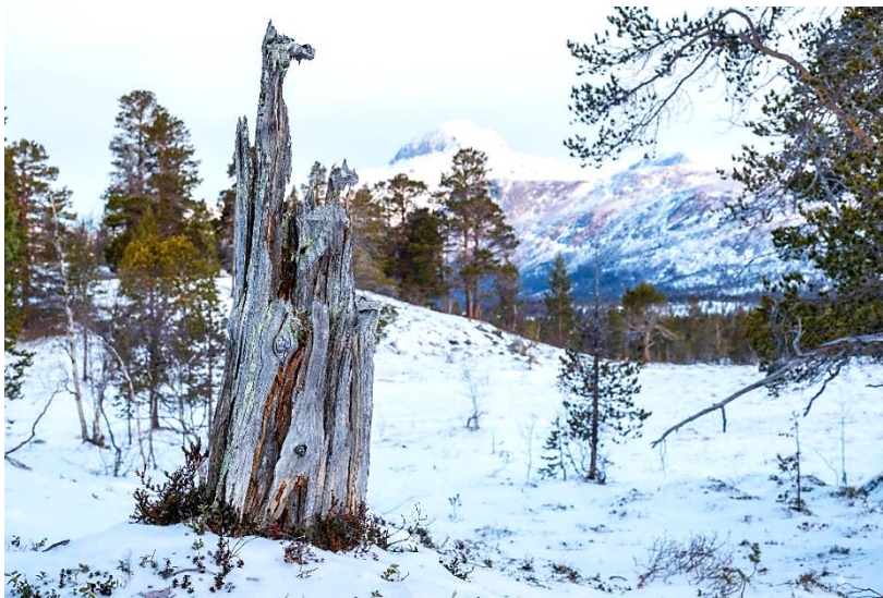
Bilde 2 Tørrgadd i Dypen.

Soppmyggarten Exechiopsis forcipata ble kartlagt av Tjærandsen i 2019. Denne arten er kun kjent fra noen få lokaliteter på landsbasis, og regnes som sårbar på rødlista.