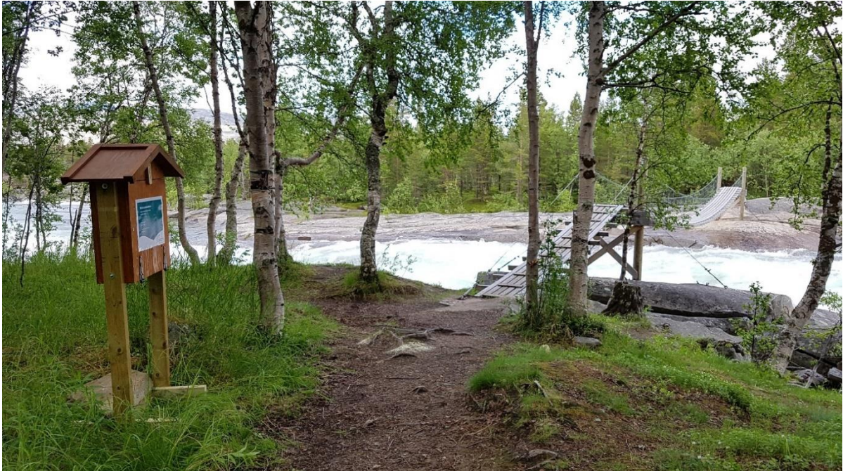
Bilde 4 Brukerundersøkelse 2017. Svarkasse ble satt ved inngangen til Dypen naturreservat.

DNT-stien, Nordlandsruta, krysser Dypen naturreservat og på den måten får området også en annen type besøkende som bare går rett igjennom verneområdet. I tillegg vil det være noen forbipasserende langs E6 som benytter området til korte turer noe brukerundersøkelsen langt på vei indikerer.