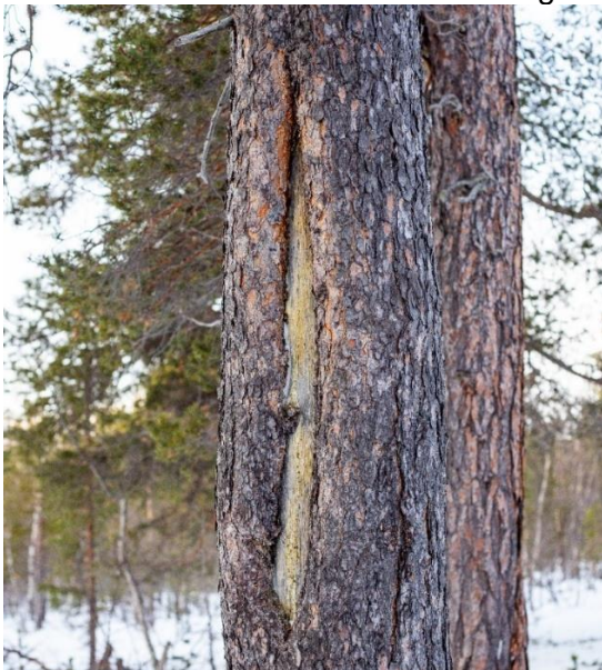
Bilde 6 Samisk barktaking på en gammel furu i Dypen naturreservat.

Den samiske reindriftnomadismen gikk i en øst-vest-retning mellom Norge og Sverige, og Dypendalen var sentral i dette trekket. Samene ankom Dypen på våren og reinen kalvet i området. Det er registrert 29 árran (ildsted) i Dypen og åtte árran like sør for Dypenåga. Dette tyder på at samene bodde i dette området når reinen var på vårbeitet på norsk side. Området var ikke bare viktige vårbeiter, men også for samenes høsting av furuas innerbark, som ble benyttet til en rekke formål. Samene høstet av de gamle furuene, men de kunne ikke hugge disse da de ble ansett som hellige etter at de ble høstet av. Dypen har en stor tetthet av barktatte furuer som alle er svært gamle.