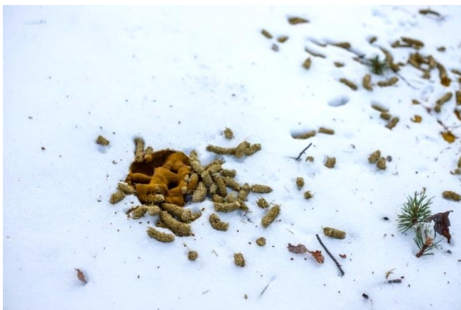
Bilde 3 Tiurbæsj i Dypen.

Dypen har også bestander av lirype (NT) og andre hønsefuglarter, og det er sannsynlig at det er både orrfugl- og storfuglleiker i naturreservatet. Dypen inngår også i faste revir for jerv (EN) og gaupe (EN). I tillegg finner vi vanlige pattedyrarter som elg, hare, mår og rev for å nevne noen.