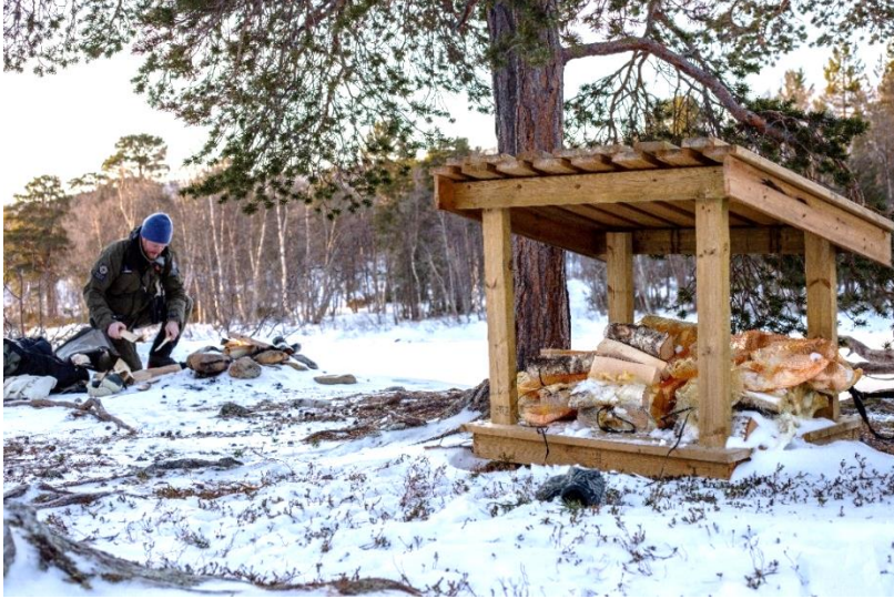
Bilde 7 Tilrettelagt bål plass ved Lønselva.