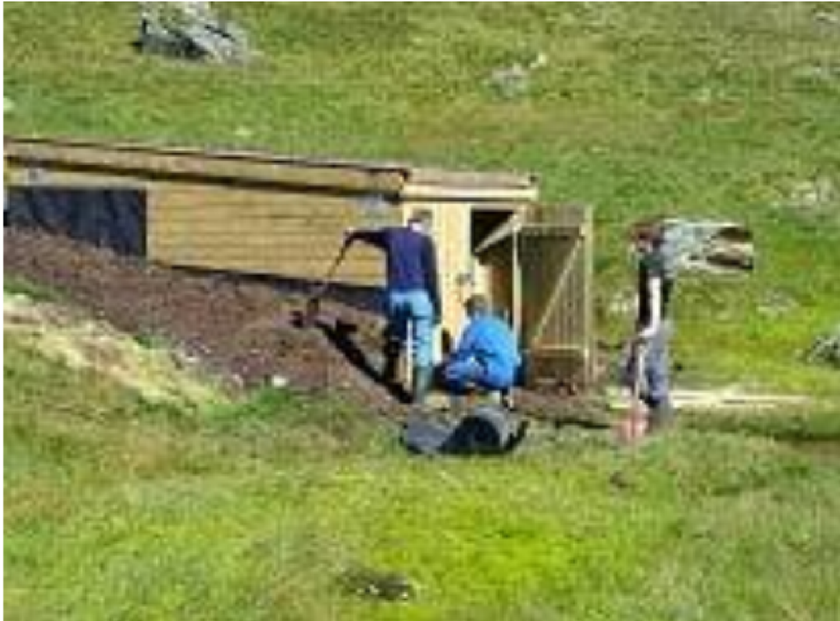
Figur 2 Bilde innsendt som rapport 29.11.2016.

Tiltaket med rampa er utført utan løyve etter verneforskrifta. Verneområdestyret sende førehandsvarsel om retting av tiltaket 19.09.2024. I førehandsvarselet vart det varsla om pålegg om retting som innebar følgjande: