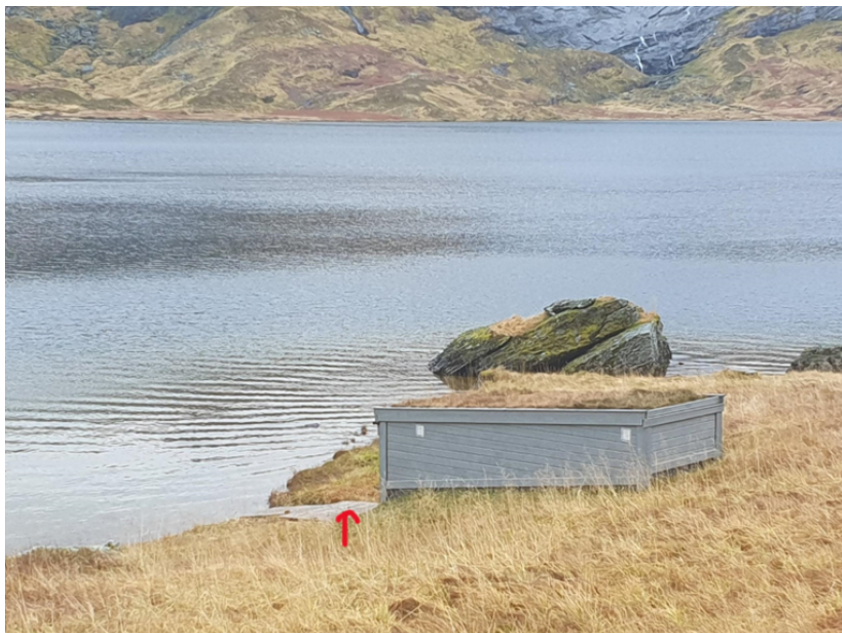
Figur 5. To bilete av naust og rampe frå søknaden.