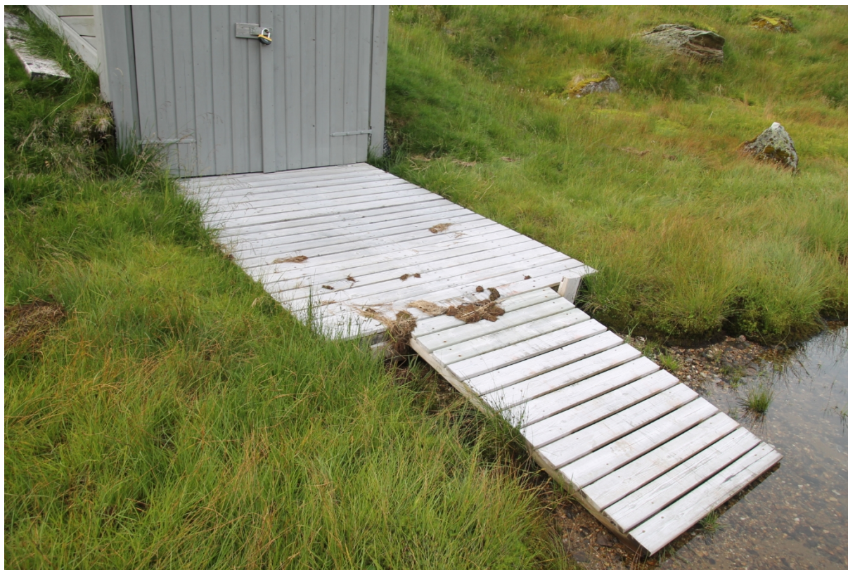
Figur 4. Bilete av rampa ved naustet.