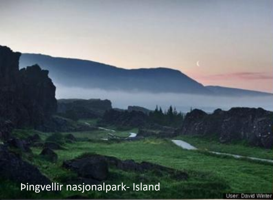
Þingvellir nasjonalpark- Island