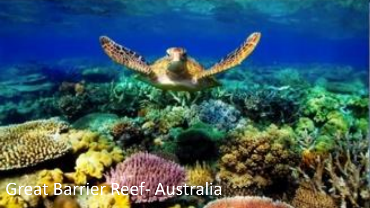
Great Barrier Reef- Australia