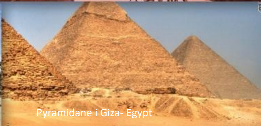
Pyramidane i Giza- Egypt