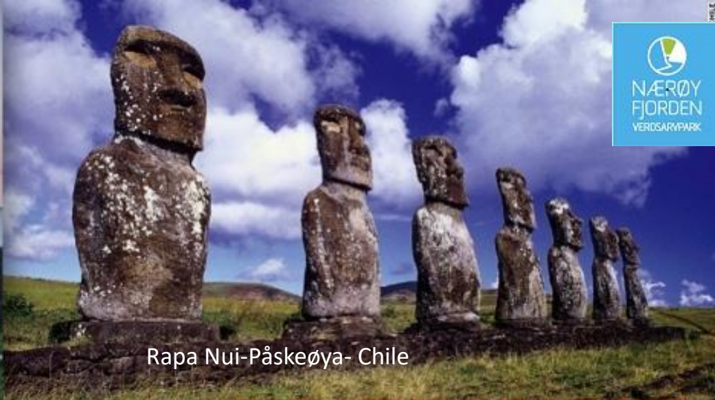
Rapa Nui-Påskeøya- Chile