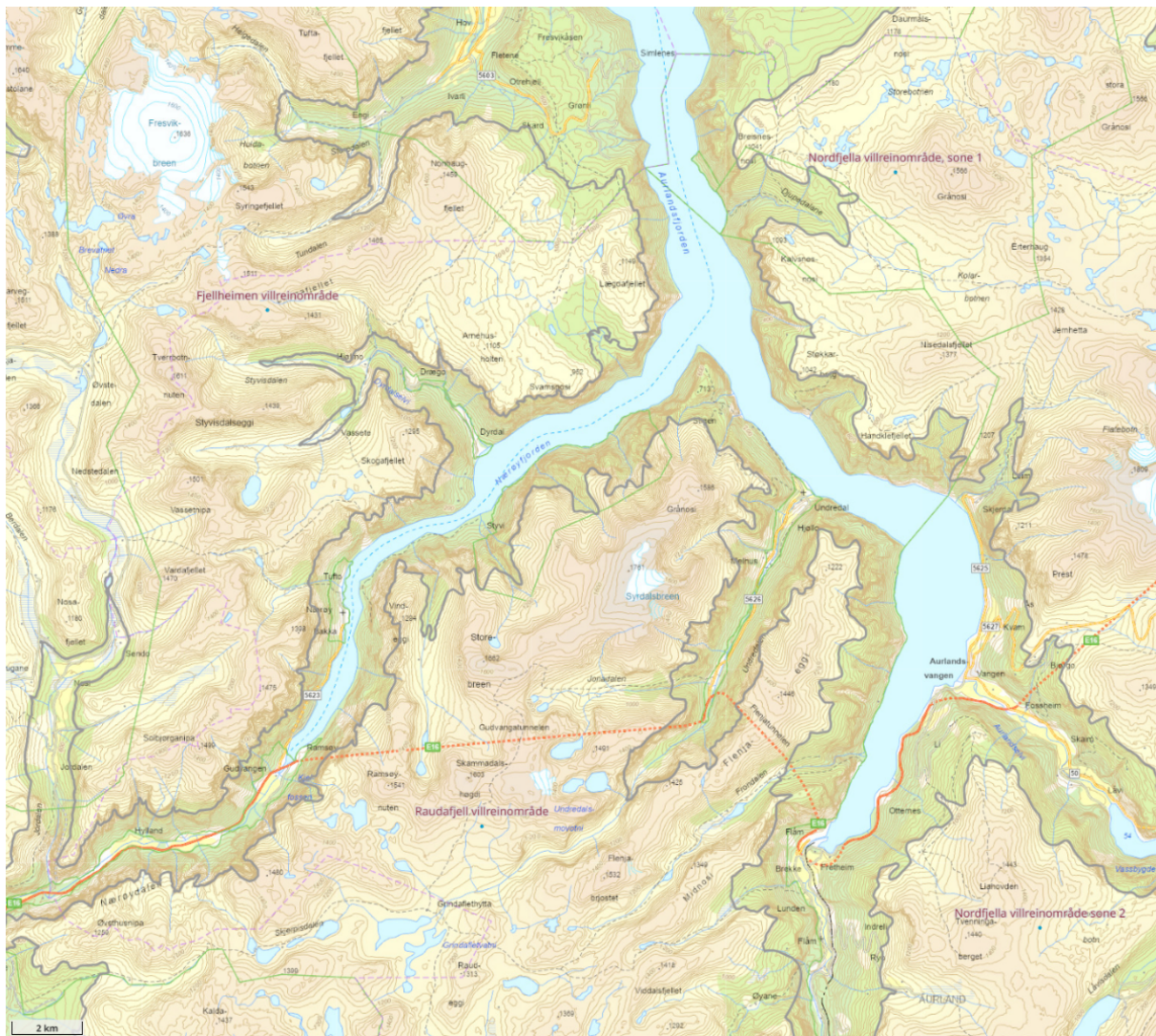
Figur 1 Kartet viser verneområda og villreinområda der det er storviltjakt. Kopi frå fylkesatlas

Økosystemtilnærming og samla belastning på verneområdet skal vurderast jf. nml. § 10. Det er aktivitet med motorisert ferdsle i desse fjellområda i samband med forskning og forvaltning av villreinen, og transport i samband med tiltak for å unngå smitte av skrantesjuke. I Bleia-Storebotnen er det i tillegg stor aktivitet med helikopterflyging i samband med bygging av ny kraftleidning gjennom området. Dette arbeidet skal vera avslutta i 2026. Det er vanskeleg å sei kva tid den samla belastninga er for stor i området, men det er viktig at det ikkje vert meir motorisert ferdsel enn det som er strengt naudsynt. Aurland hjorteutval rapporterte i fjor at det vart gjennomført 21 turar på 5 ulike dagar for utflyging av hjortevilt. Både villreintutvalet for Raudafjell, og villreinnemnda for Nordfjella, Fjellheimen og Raudafjell, har uttalt at villreinen i Raudafjell har vorte negativt påverka av den høge aktiviteten med helikopter som har vore siste åra. Villreinnemnda seier vidare at villreinen ikkje skal uroast unødige, og at det bør vera ein høg terskel for å gje løyve til helikopterflyging etter villreinen er reetablert i Nordfjella villreinområde sone 1.