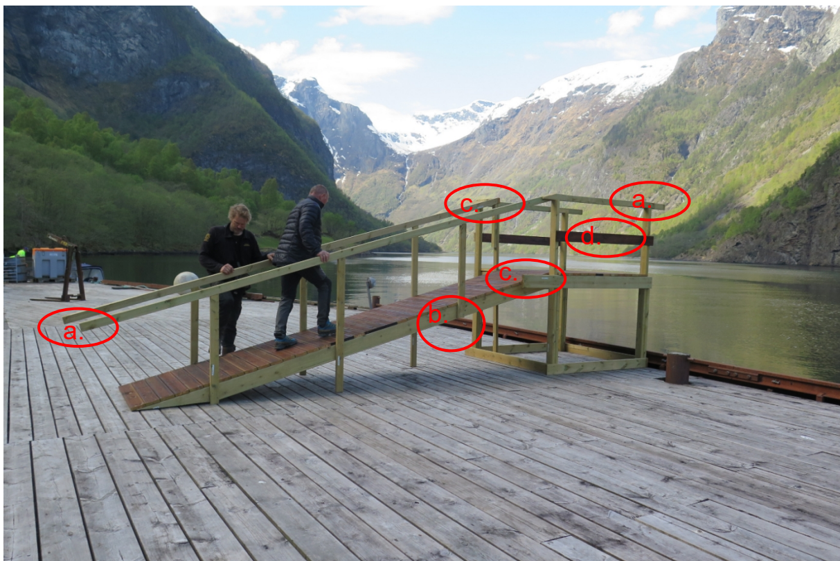
Figur 2. Rampa med eksempel på ulike punkt som kan forbetrast. Lista er ikkje uttømmende. a. Treng rekkverket å stikke lenger ut enn rampa? Det må i alle fall sikrast at endane er like lange. b. Ein av stolpane til rekkverket er kutta ved rampa, dei andre går i bakken. Dette må vere likt. c. skråskjere plankeendar slik at dei passar. d. Byte ut dei to brune plankane med same material som er brukt på resten av rekkverket.

Slik rampa står i dag ser den nokså uferdig ut, mellom anna med plankeendar av ulik lengde som stikker lenger ut enn nødvendig, ulik lengde på stolpane til rekkverket og ulik farge på materialen som er brukt (Figur 2). Forvaltar trur inntrykket besøkjande får av rampa vil bli betre dersom desse tinga blir retta opp og det blir gjort litt meir flid med ferdigstilling av rampa. Med tida vil treverket på sidene og rekkverket gråne og likne meir på fargen på kaidekket. Den vil då passe betre inn og verke mindre dominerande.