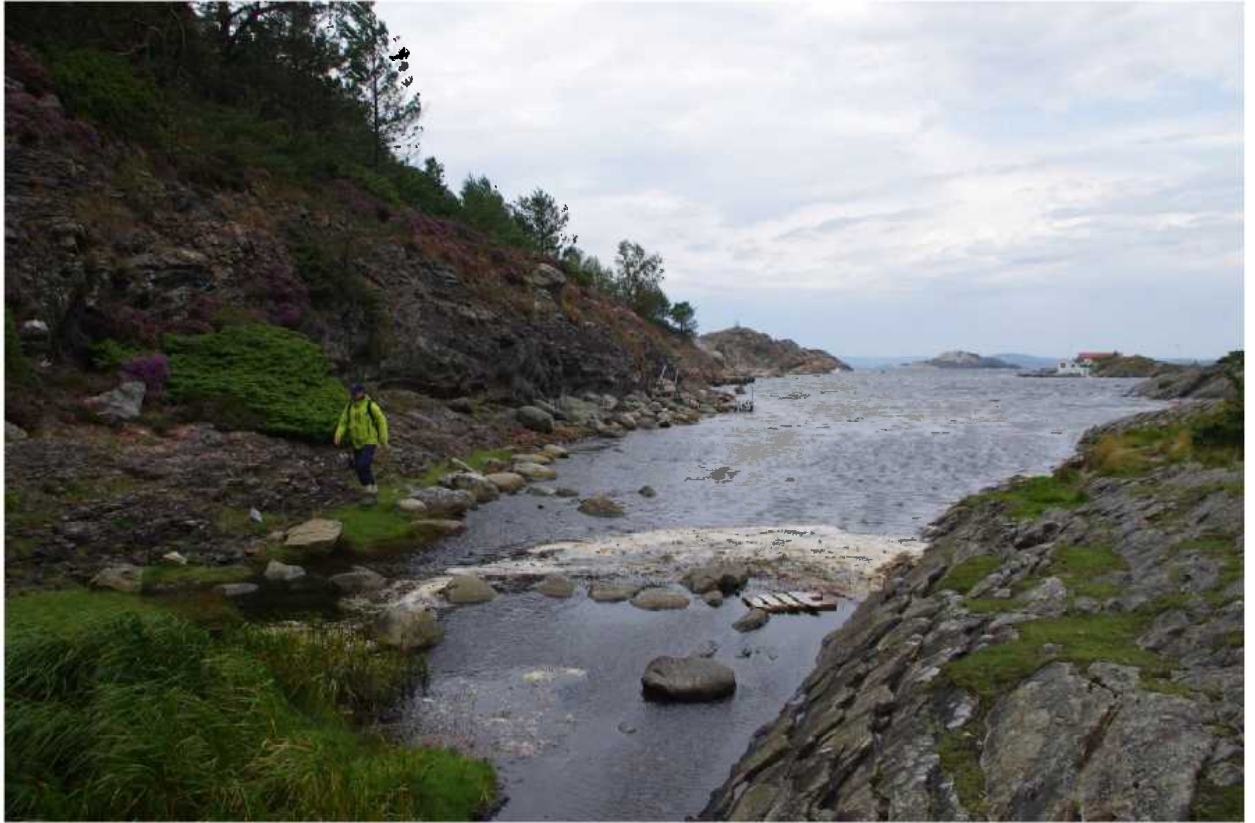
Bilde: Stitrase mellom Asperøya og Sudredalen sett fra sør. Brygga i Sudredalen skimtes i bakgrunnen midt i bildet.