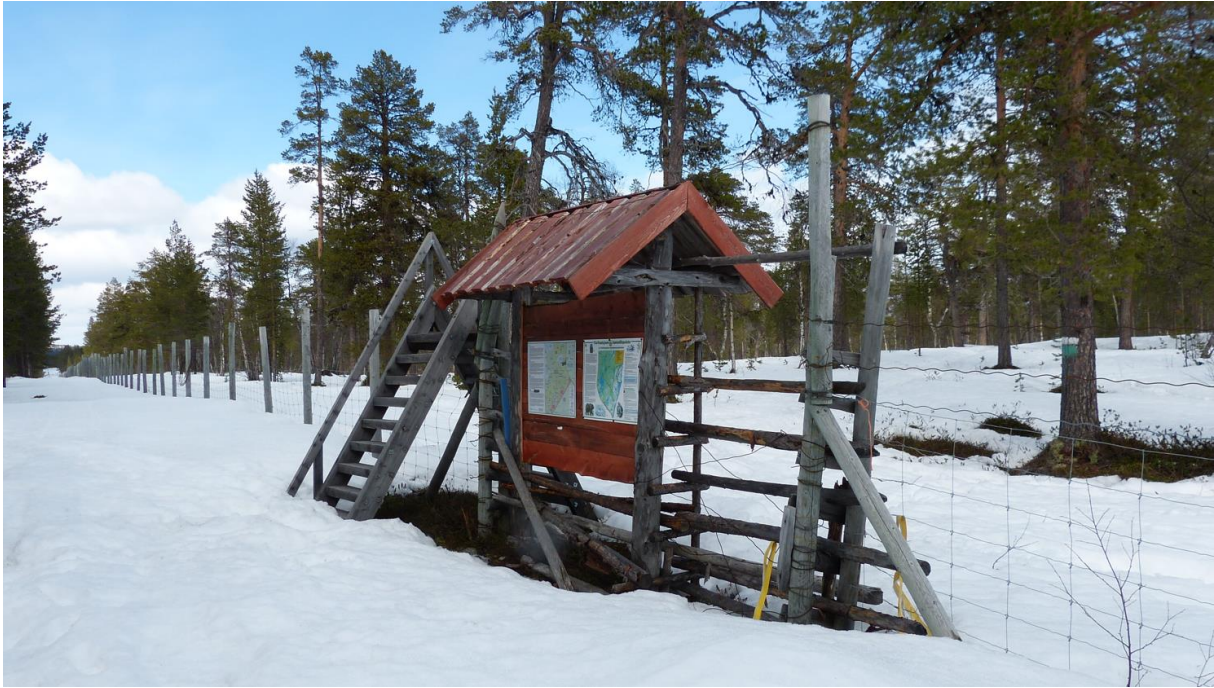
Bildet viser Piilolaporten, tatt fra finsk side.