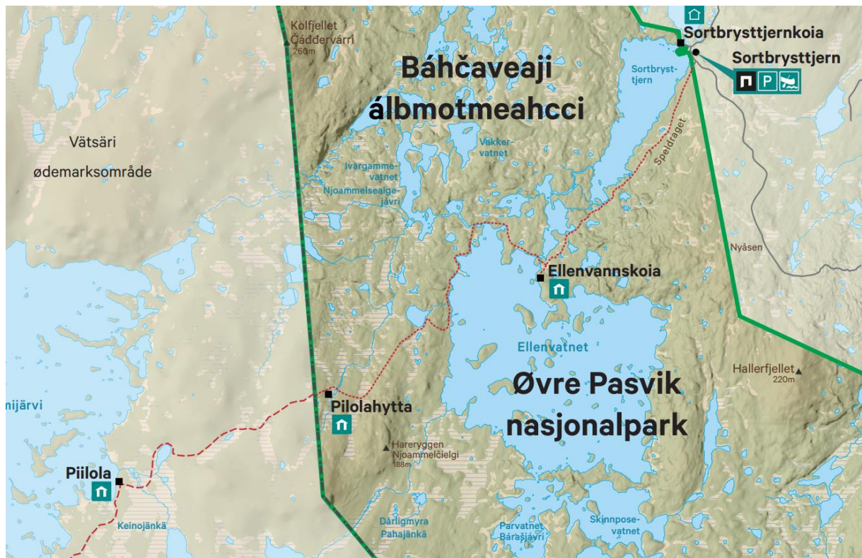
Kartet over viser deler av Øvre Pasvik nasjonalpark og Piilolastien (rød stiptet linje).

Den grensekryssende Piilolastien ble etablert i 2009 gjennom samarbeidet i Pasvik Enare trilaterale park. Vandreturen gjennom Øvre Pasvik nasjonalpark og Vätsäri ødemarksområde i Finland er på ca. 35 km. Fra norsk side starter stien