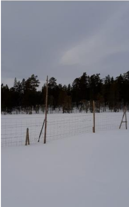
Klipp fra videoen som viser reparert gjerdestrekk

Forvalter har vært i kontakt med det lokale reinbeitedistriktet som bruker Øvre Pasvik nasjonalpark som vinterbeite. De forteller at de i 2021 reparerte aktuelle gjerdestrekk som hadde sunket i myr og våtmark, og sendte video av aktuelle strekk til forvalter. De ser ikke behov for å endre gjerdetrase.