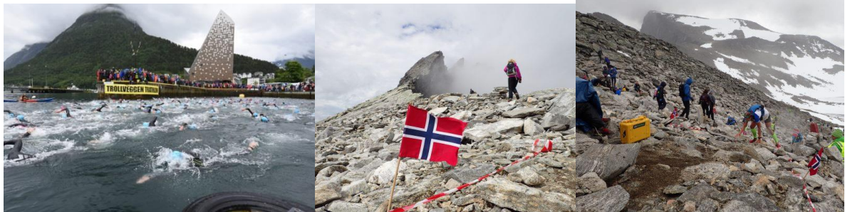
Fullteikna, med maks 200 deltakare.