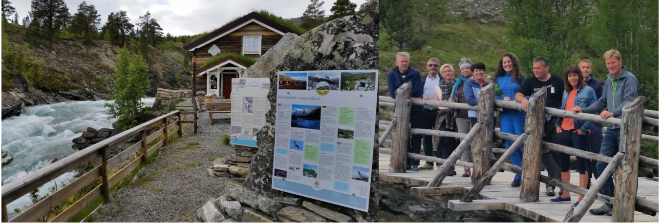
Nasjonalparkstyret på utleggsbrua langs Diktarstigen på Billingen, 27.juni.