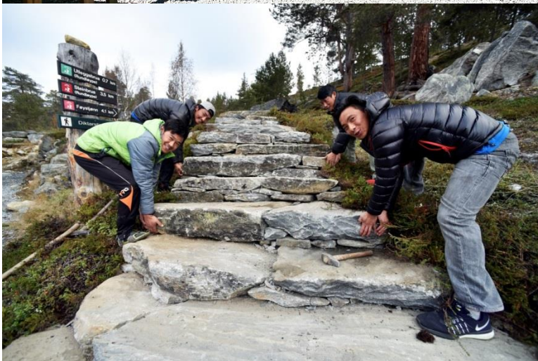
Sherpaarbeidarar ferdigstillar ny steintrapp til Reinheimen, oktober 2016