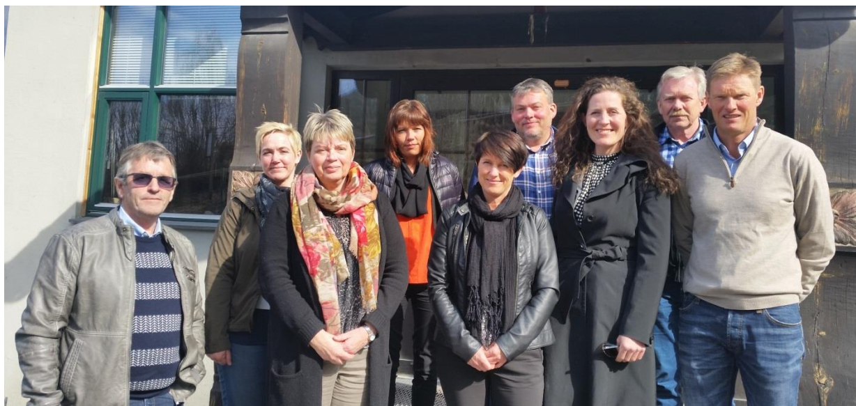
Nasjonalparkstyret for Reinheimen 2016 – 2019, konstituert 14.03.2016

Årsmeldinga gir ei framstilling av nasjonalparkstyret sitt arbeid, tiltak og generelt om bruken av områda og dei naturfaglege tilhøva og forvaltningsmessige utfordringar i Reinheimen og tilhøyrande landskapsvernområde.