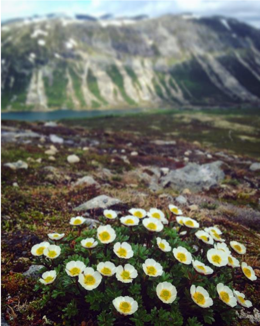
Issoleie eller reinblome på veg ned mot Tunga.

Miljøvernmyndighetene lanserte en ny merkevare- og besøksstrategi for Norges nasjonalparker, på Nasjonalparkkonferansen i Trondheim 13.-14.april 2015. Målet er at flere skal besøke nasjonalparkene. Snøhetta Design AS har utforma den nye felles visuelle identiteten og merkevaren for Norges nasjonalparker og naturinformasjonssentre. Arbeidet med å implementere den nye merkevaren med ny visuell identitet for alle nasjonalparkene tek tid, og krev finansiering. Det er 4 verneområder (pilotane) som har fått ekstra midlar til merkevarearbeid.