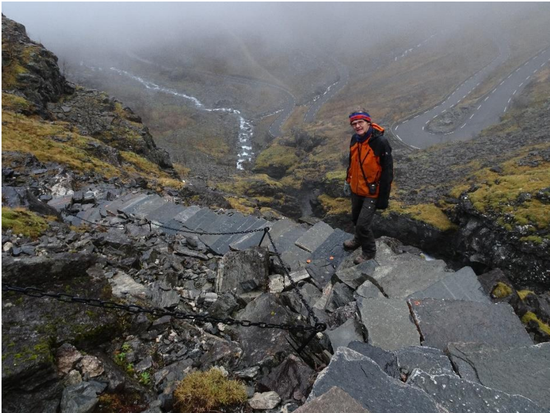
Nils Hole leiar arbeidet med utbetring av Kjøvstigen