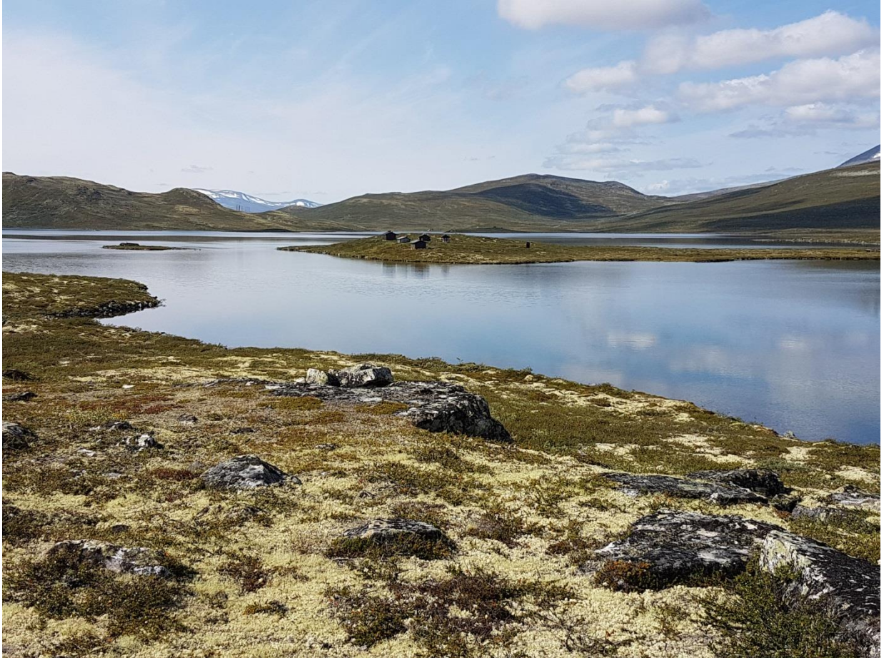
Fiskebuer på Honnsjoodden i Ottadalen landskapsvernområde