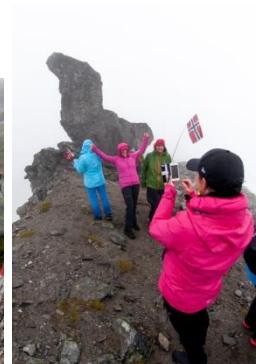
Fullteikna, med maks 200 deltakare.

(Foto: frå arrangementet i 2017, Norsk Fjellfestival)