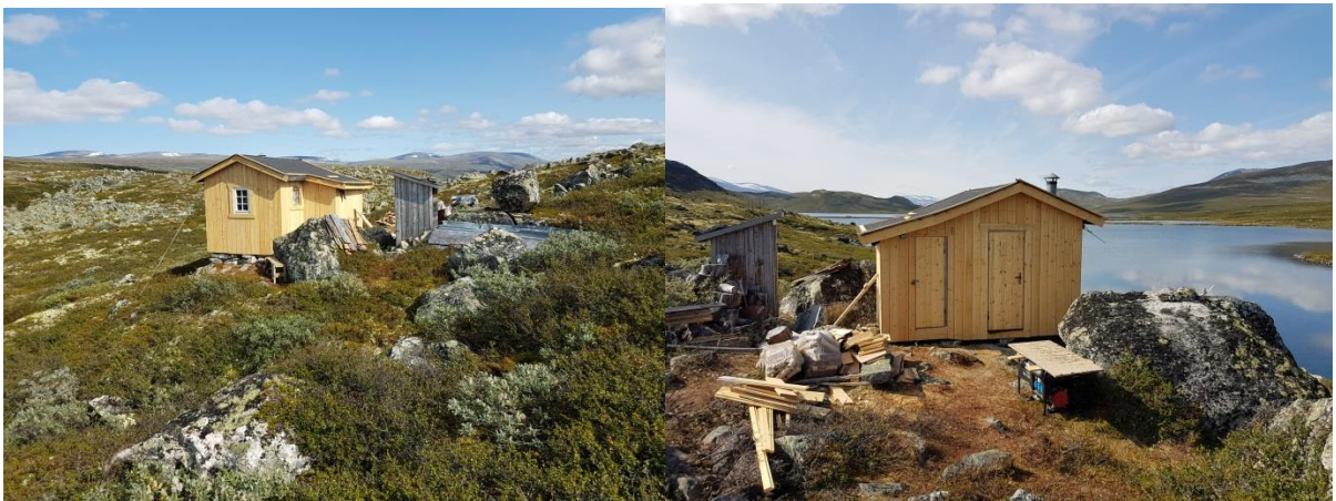
Restaurering av Honnsjobue til Finnadalen fjellstyre