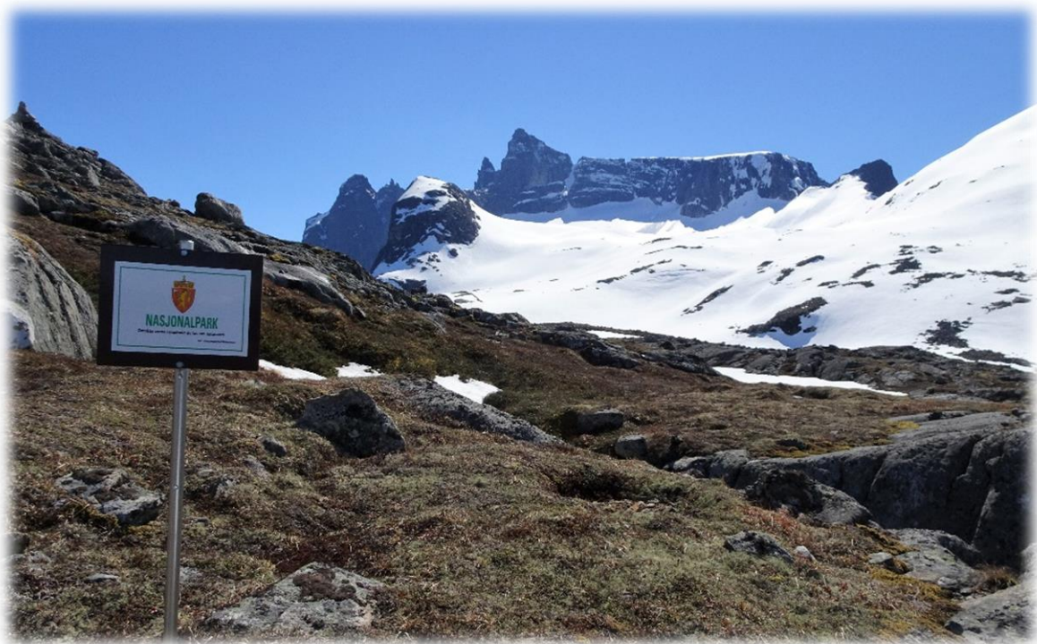
Trolltindane i Reinheimen nasjonalpark.

Årsmeldinga gir ei framstilling av nasjonalparkstyret sitt arbeid i 2017, tiltak og generelt, om bruken av områda og dei naturfaglege tilhøva og forvaltningsmessige utfordringar i Reinheimen og tilhøyrande landskapsvernområde.