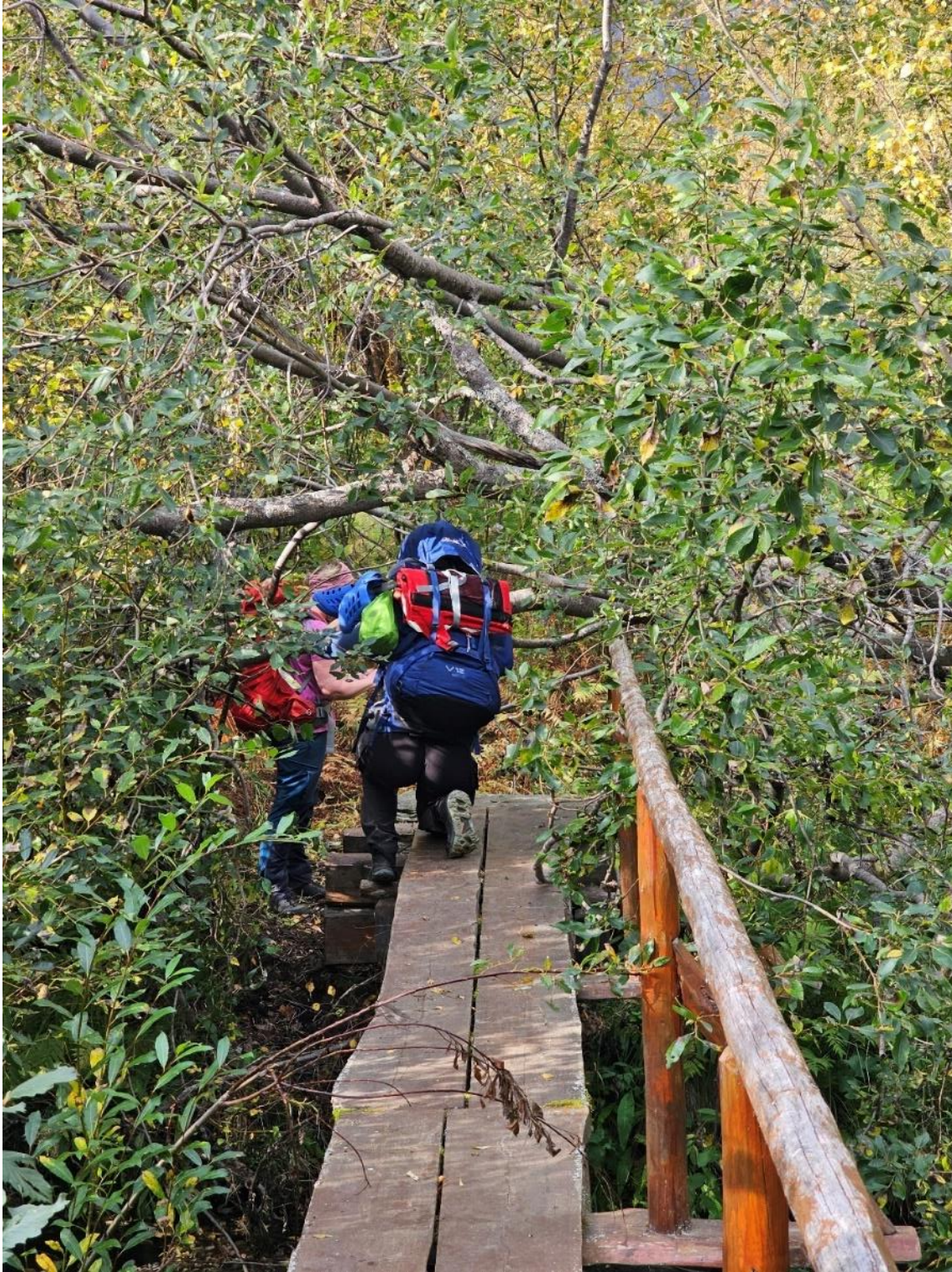
Figur 3: Busk som har ramlet over en av bruene i sommer langs hovedstien