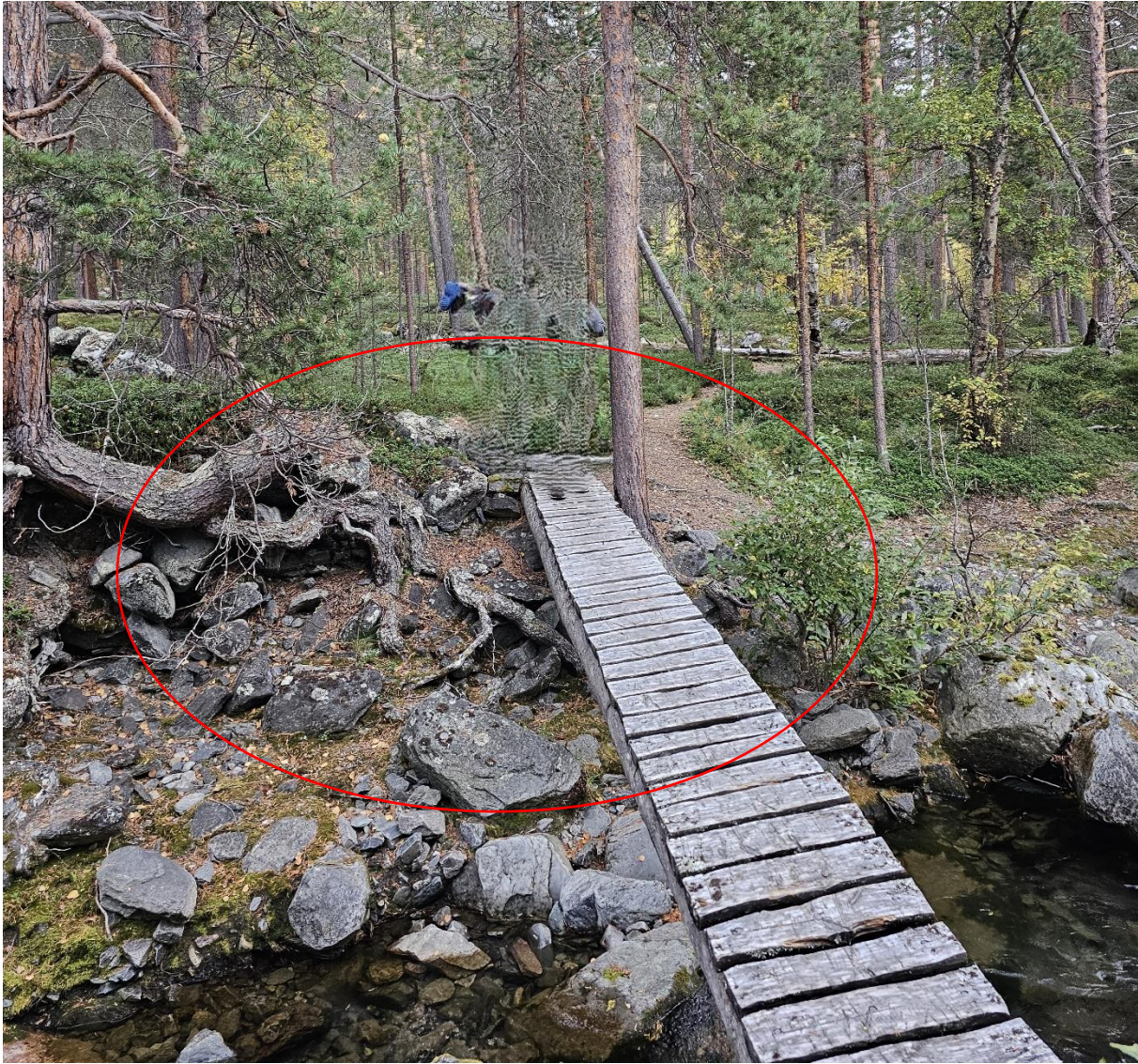
Figur 4: Rød ring viser elvas utgraving under brukaret