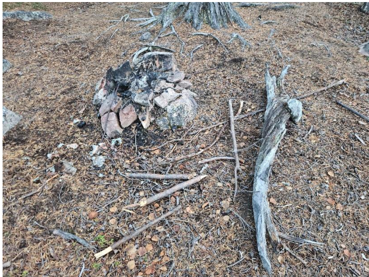
Figur 1: Ved Imofossen. Skade på trær og bruk av bål. Ingen rasteplass her

Vi søker om kr 200 000,- til dette tiltaket.