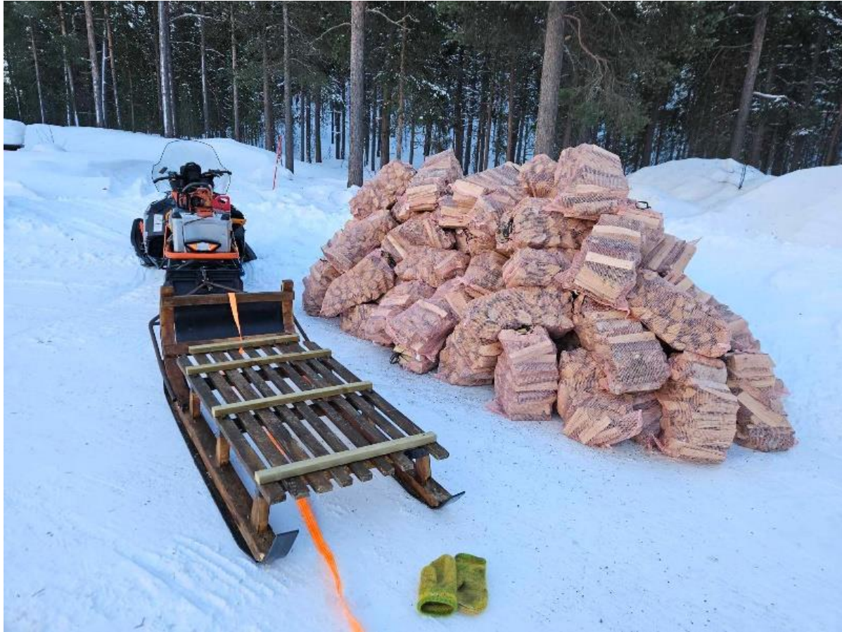
Figur 2: Sekkeved kjøres dit det er mulig å oppbevare veden under tak. Stangeved kjøres til rasteplasser uten tak