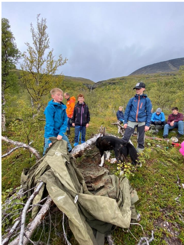
Bilde 1: Ungdom finner gammel presenning.

I september støttet nasjonalparkstyret to skoleturer med Bardu ungdomsskole. Den ene turen gikk ruta Tornehamn-Lappjord-Sørdalen. Den andre skoleturen gikk inn Stordalen med formål om å plukke og samle søppel og rask. I løpet av tre dager samlet elevene omkring 250 kg søppel. Det meste var gammelt utstyr fra jaktdepot, inkludert kjøkkenutstyr, telt, gummibåt og kano.