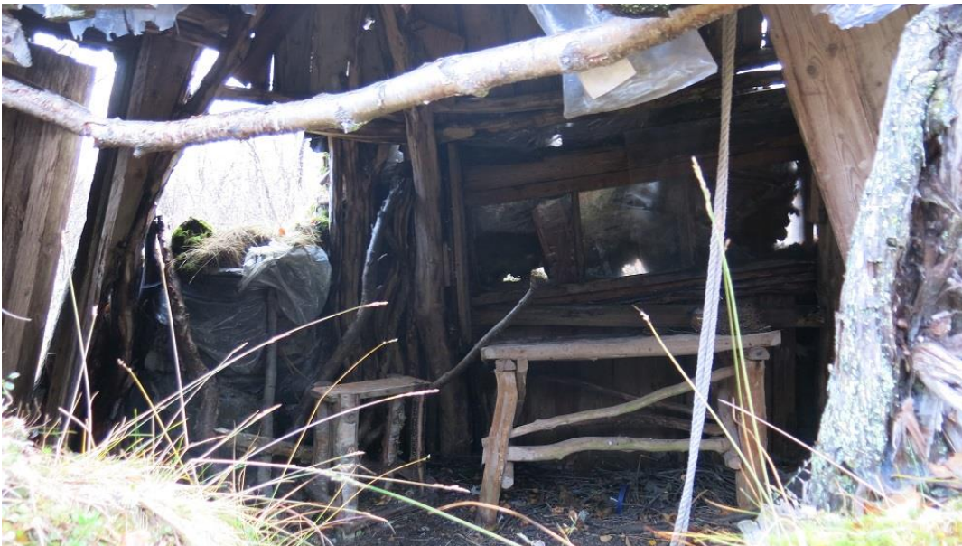
Bilde av gammen tatt høsten 2020.