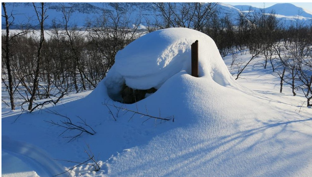
Gamma i Stordalen godt dekt med snø.

Særlige bestillinger eller føringer fra staten ved Miljødirektoratet eller departement kalles sentrale bestillinger og føringer.