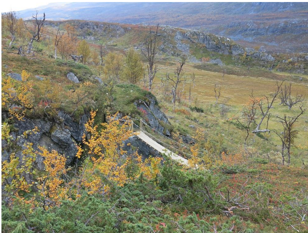
Hengebrua over Ruovdegorsajohka.