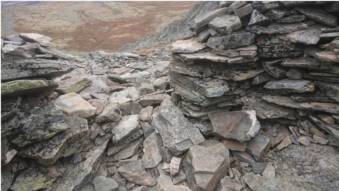
Skader på fangstrusa på Formokampen.

Det ble under ledelse av Fylkeskommunen gjennomført vedlikehold på fangstanlegget på Formokampen.