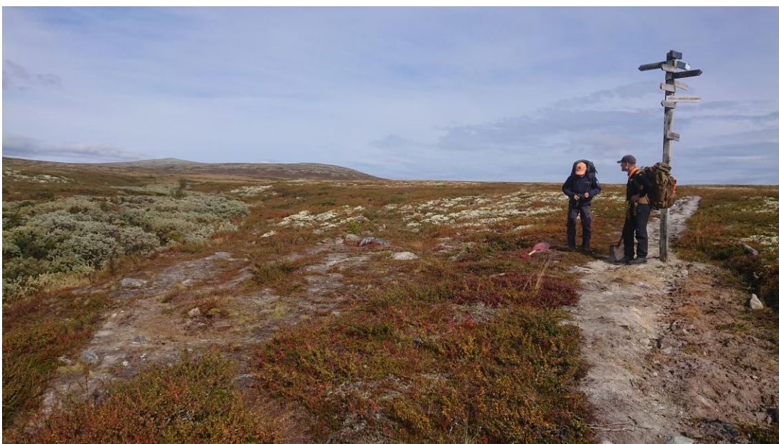
Stidele ved Dørmyrin.

Omleggingen av hytte og stinettet til DNT er gjort av hensyn til villreinen sin arealbruk. Etter at det ble foretatt en mindre fjerning av gamle T-varder og tydeliggjort T-stien i sti delene har vi ikke fått meldinger om at turgåere har gått feil. Noe av utfordringene er at det er mange gamle papirkart som viser den gamle ruten som ikke lenger er merket i terrenget. Mange plasser er denne stien også vanskelig å finne.