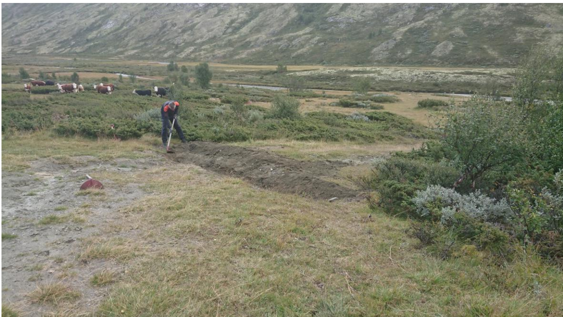
Avskjæring av vei ned til Grimsa.

I 2021 har det vært fokus på parkering av bil langs Grimsdalsveien og Dørålseterveien. Dette er fulgt opp med en betydelig tilstedeværelse. Bakgrunnen for innsatsen var at man i 2020 gjennomførte en avgrensning av mulighetene for å kjøre ut fra Grimsdalsveien. Disse endringene ble fulgt opp med kontroll i 2021.