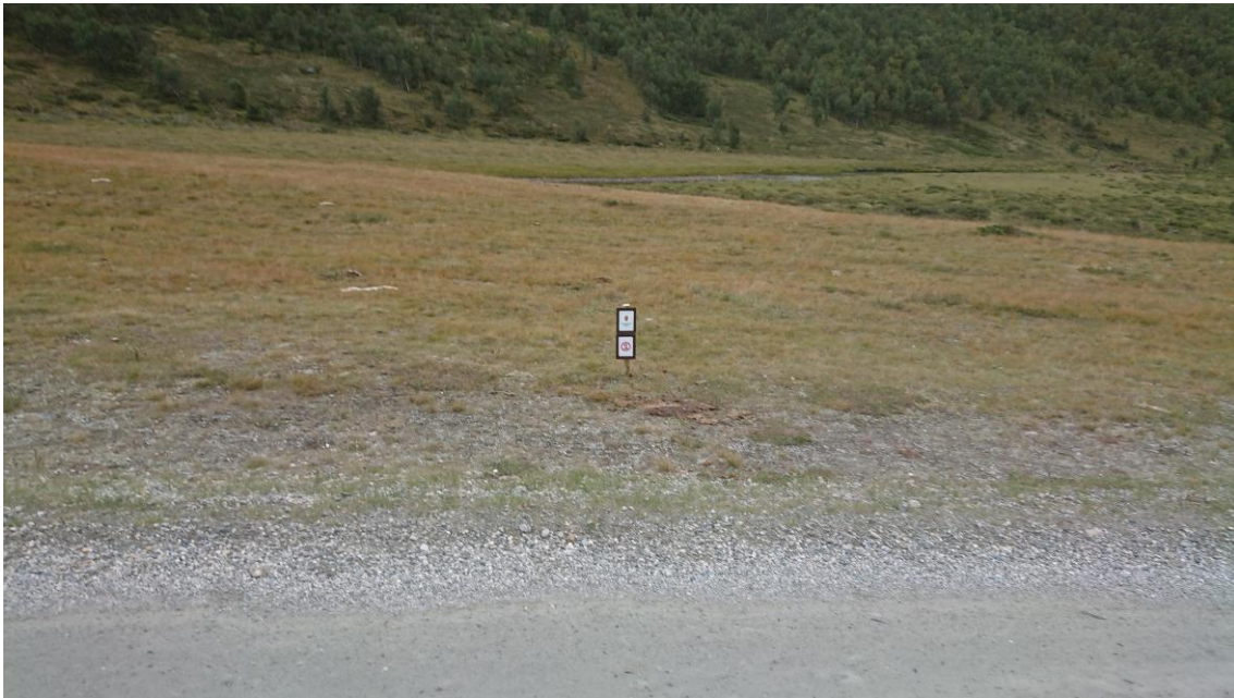
Skilting av hvor det ikke er tillatt å parkere/kjøre.

Tidligere har det vært en kultur for å parkere langs veien i Grimsdalen på flere steder. Nå blir de besøkende henvist til å benytte parkeringsplassene ved Bjørnsgardseter (Barthbua), Tollevshaugen (Løken), Grønbakken og Helleberget. Fjellstyret drifter på disse plassene en enkel utedo. I 2021 kom det også opp informasjon om anbefalte overnattingssteder i Dovre og Folldal. Det er mange besøkende til Grimsdalen. Disse tiltakene har styrt overnattingen til færre steder. Der det er mulig å håndtere søppel mm.