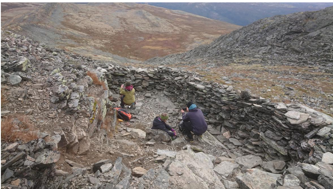
Etter at skadene på reparert.