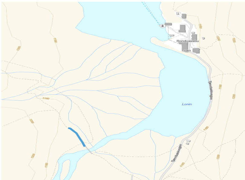
Strekning av sti mot Veslesmeden der tiltak er utført er markert med blått.

I stinettet rundt Rondvassbu er det en del erosjon på grunn av at vegetasjonen bli slitt bort på grunn av tråkk skader. Deretter blir det erosjon på grunn av vann og tråkk.