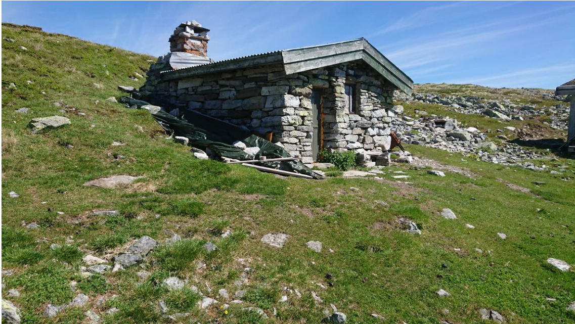
Platting fjernet ved steinbu ved Rundhøa i Vulufjell.