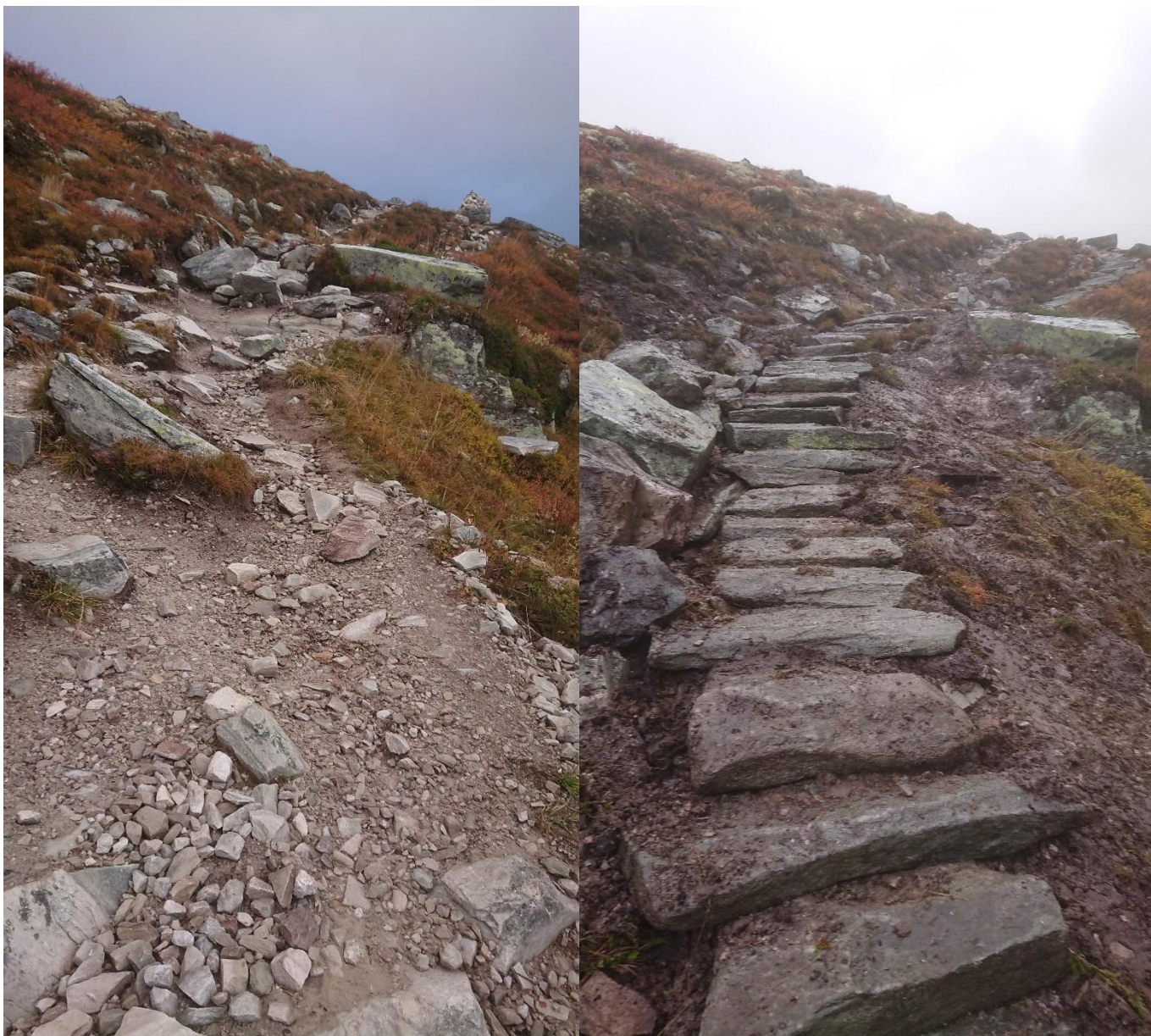
Erosjonsutsatt skråning før og etter.

Alle tiltakene er gjort i eksisterende T-merka sti.