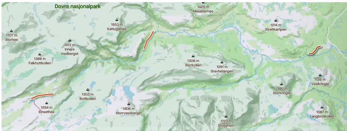
Figur 1 - De tre transektene som er undersøkt i Grimsdalen

Data fra 2016 til og med 2020 er lastet ned som årlige data, mens data for 2021 er lastet ned som månedlige data.