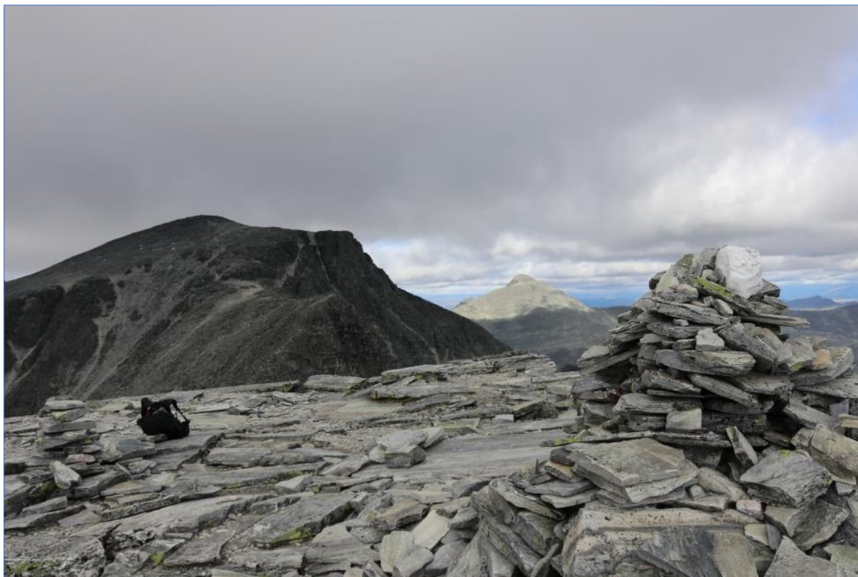
Rondeslottet og Høgronden, sett fra Vinjeronden, (31.08.21).

Sekretariatet for Rondane-Dovre nasjonalparkstyre