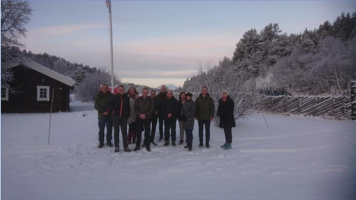
Rondane-Dovre nasjonalparkstyre på befaring, møte i Sollia 01.12.21.