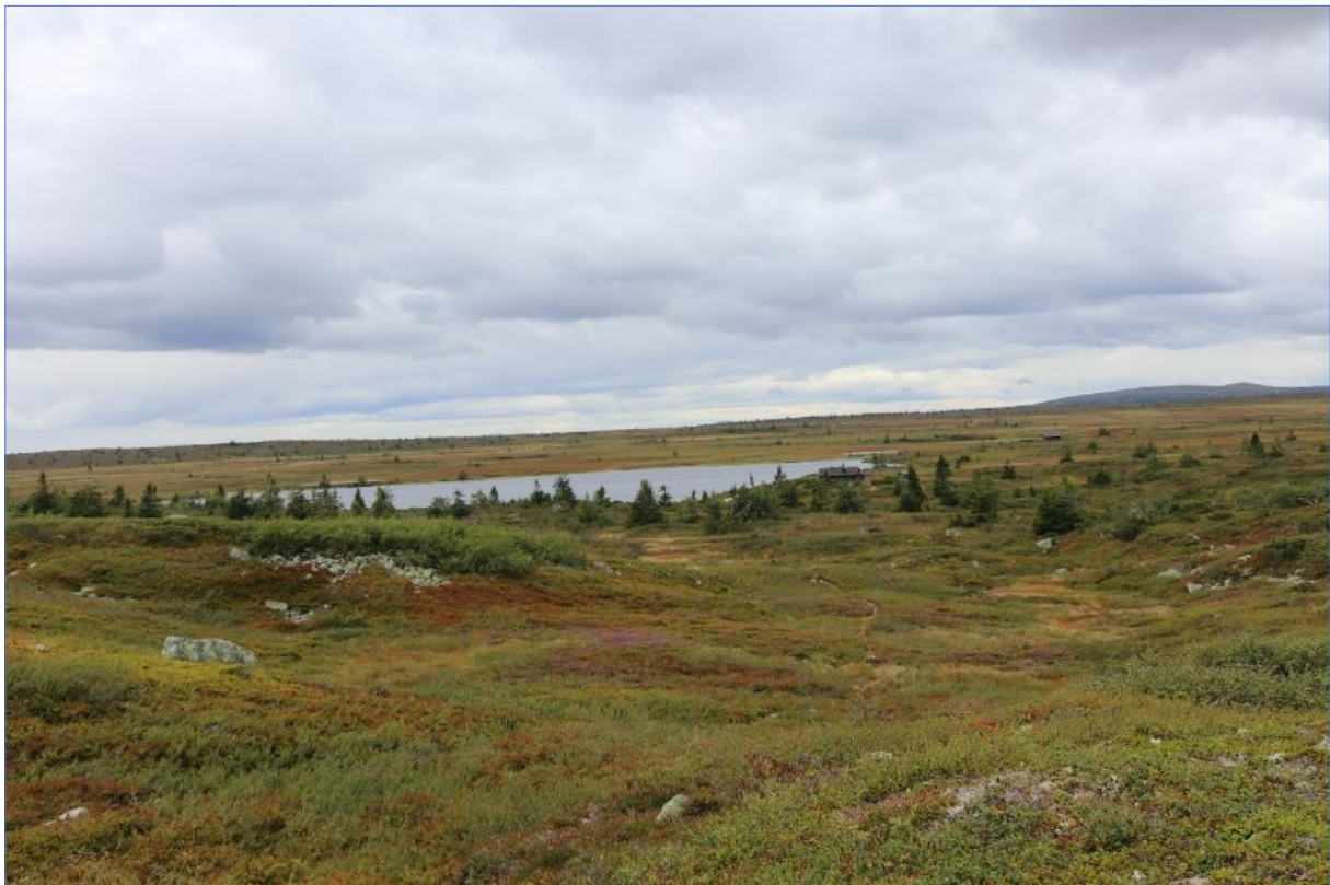
Fra befaring (18.08.21) Store Stensjøen, Hemmeldalen NR.

Rondane er i dag en av Norges mest besøkte nasjonalparker.