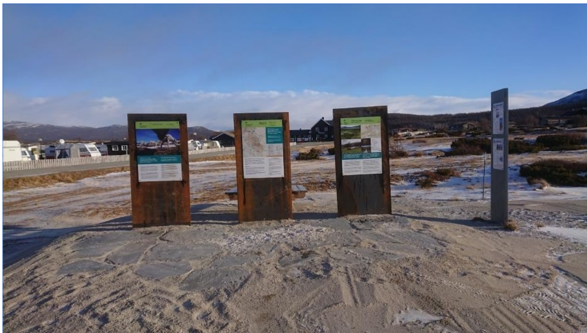
Infopunkt ved Hageseter fjellstue, (11.11.21)a.

Statens naturoppsyn har levert egne rapporter som følger som vedlegg til årsrapporten.