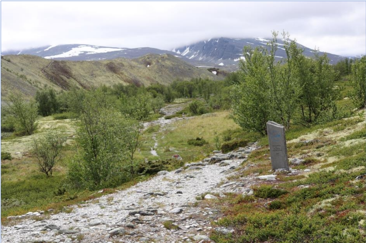
Fra befaring i Dørålen, (22.06.21).