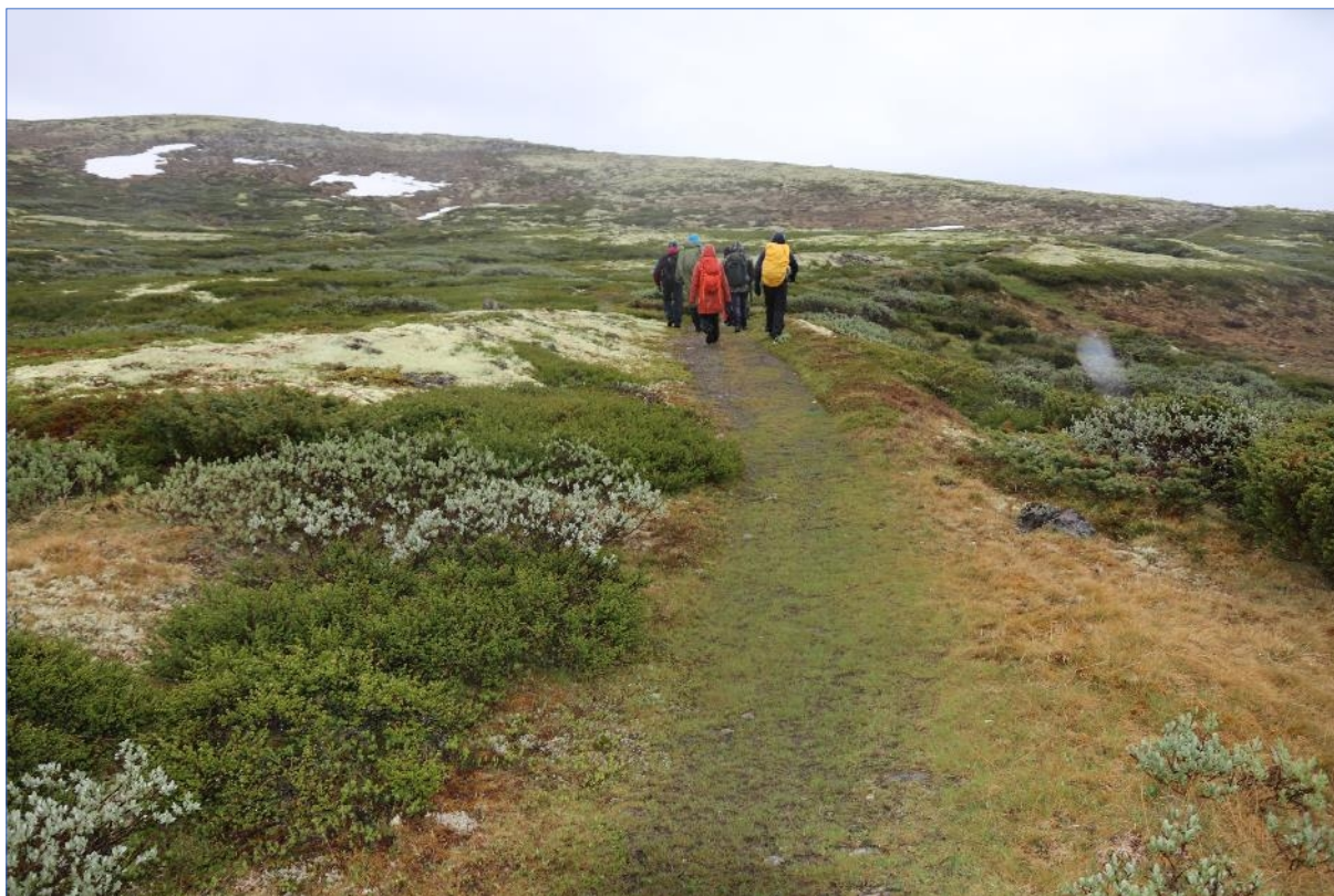
Fra befaring av Kongevegen – Dovre nasjonalpark, (16.06.21).