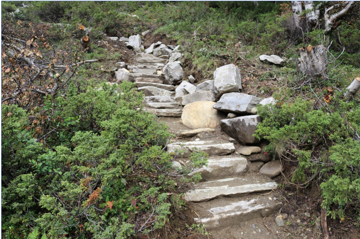
Tiltak utført på stien mellom Hageseter turisthytte og Grimdsalshytta, Nordre Tverrågjelet, august 2023.