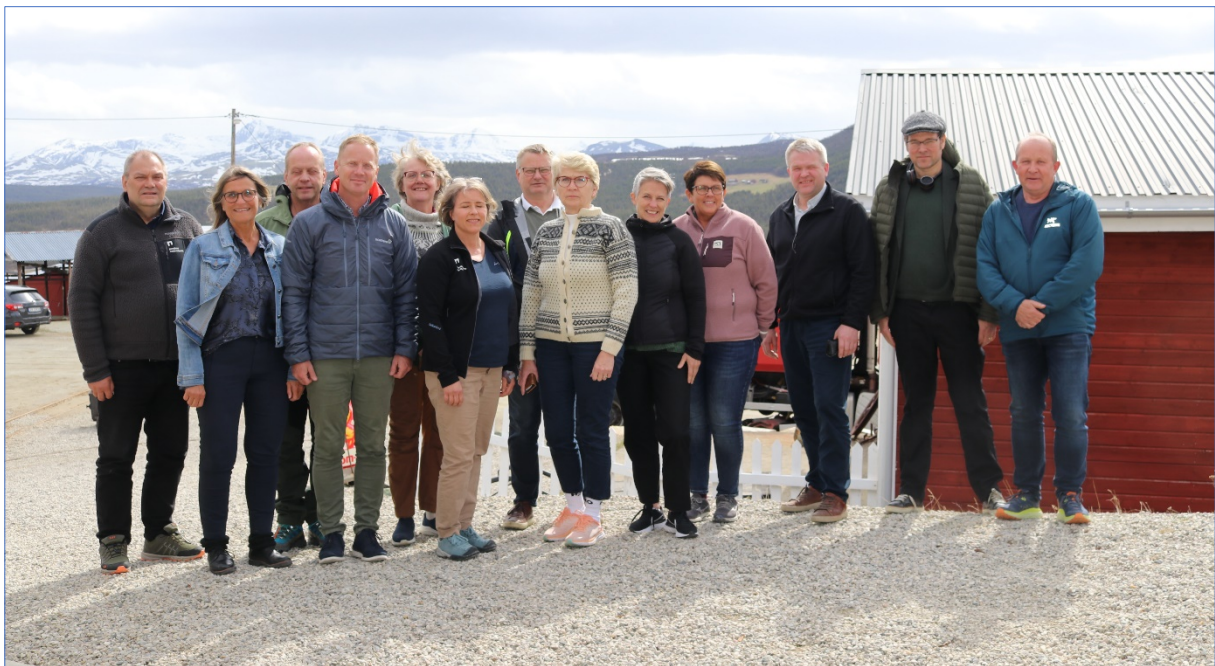
Rondane-Dovre nasjonalparkstyre, møte 26.05.23, Folldal gruver.

Rondane er i dag en av Norges mest besøkte nasjonalparker.