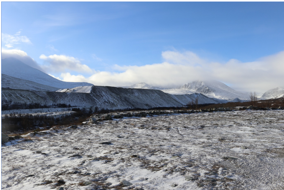
Frå Dørålen, 2023.