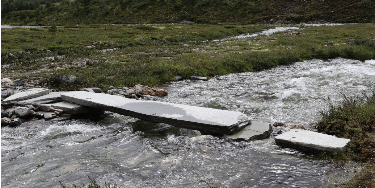
Ny klopp (skiferblokk) over Tverråe ved Bartbue i Grimsdalen LVO.