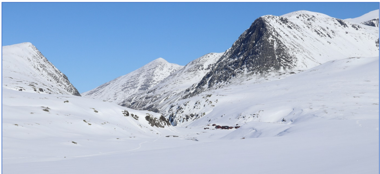
Rondvassbu, Rondane NP - fra befaring av transportrasé, 19.04.23.