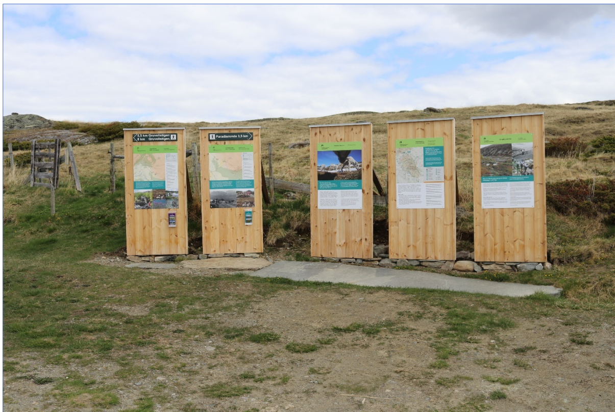
Informasjon ved Tollevshaugen i Grimsdalen, 2023.