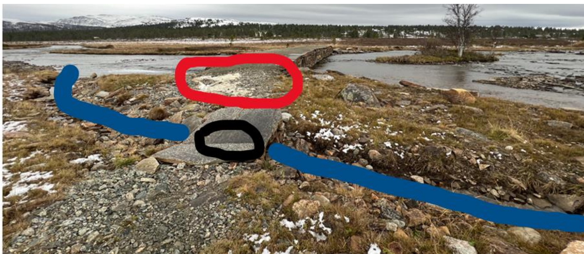
Figur Tiltak på østsida av brua.