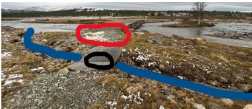
Figur Tiltak på østsida av brua.