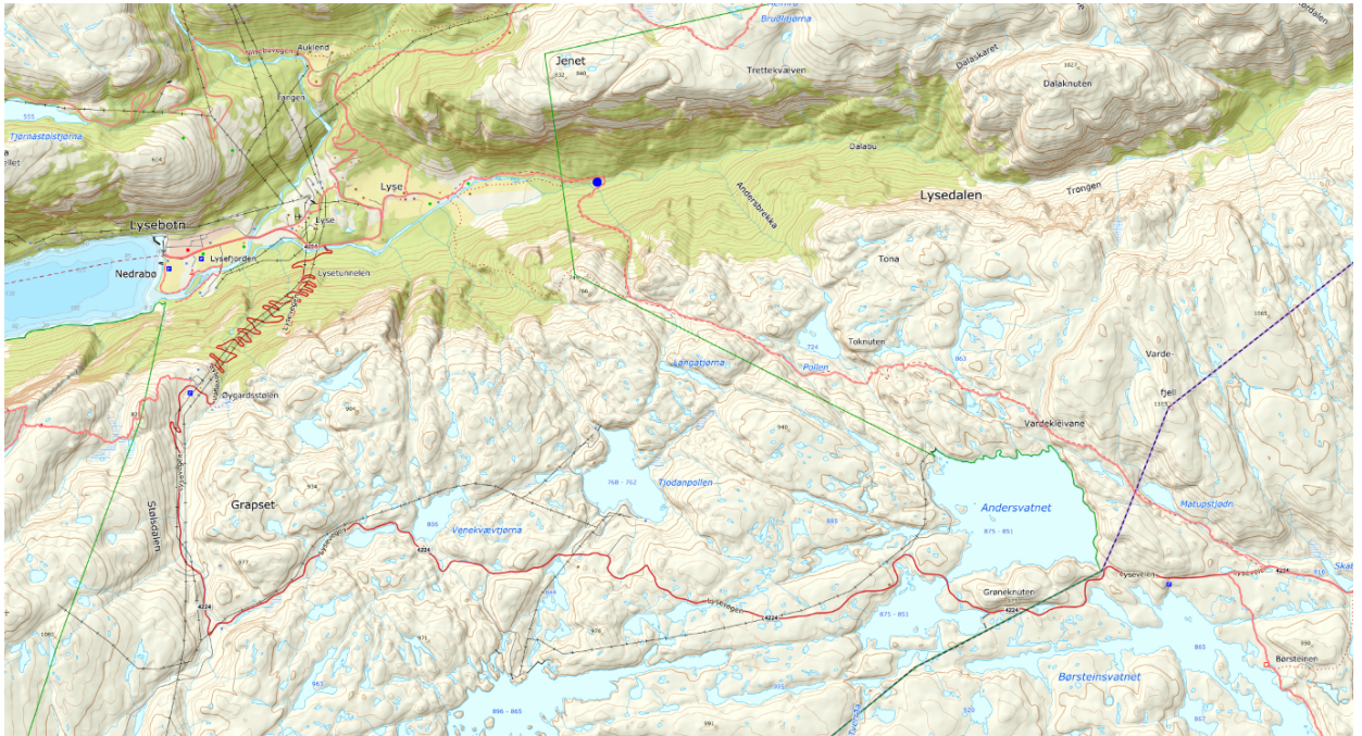
Kart som viser plassering av ny bru.

Ein vil gjere merksam på at det kan være behov for å innhente dispensasjon og/eller byggeløyve frå Sandnes kommune. På bakgrunn av innsendt dokumentasjon legg AU til grunn at grunneigar har godkjent tiltaket.