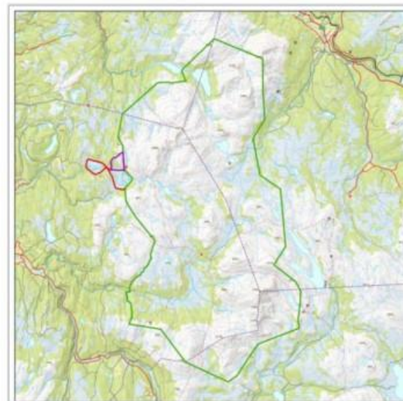
Skarvan og Roltdalen nasjonalpark og Stråsjøen-Prestøyan naturreservat

Seibu, Stjørdal, Meråker og Tydal kommuner