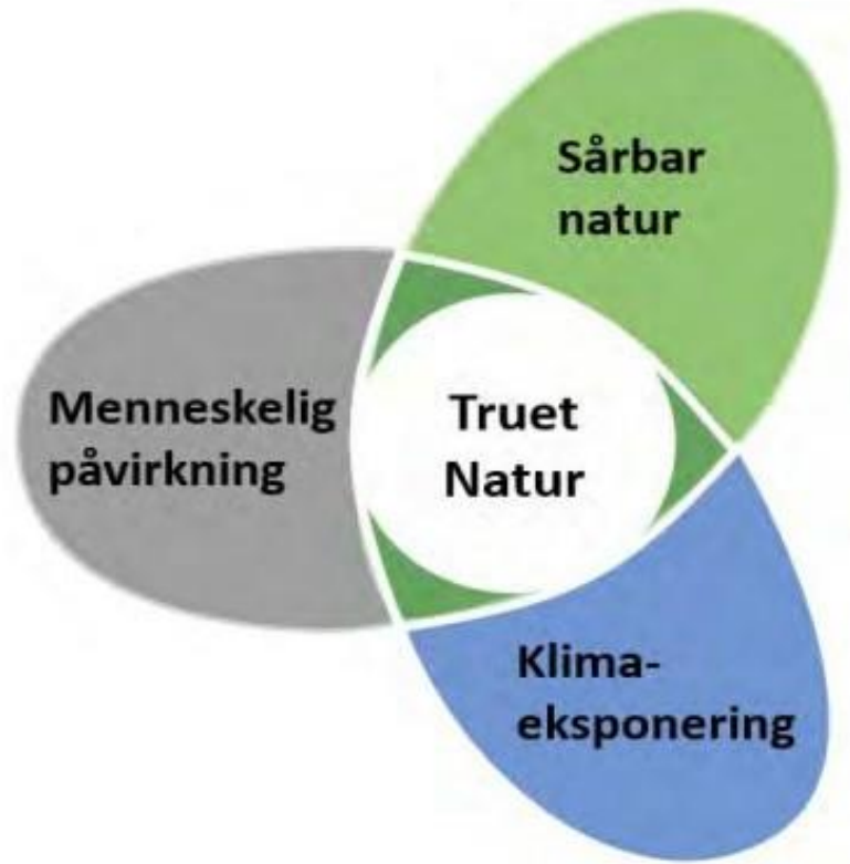
Figur 2: Andelen truet natur er avhengig av tre faktorer: Menneskelig påvirkning, klimaeksponering og sårbar natur.

Figur : Vestlandsforskning – rapport nr 4 / 2022