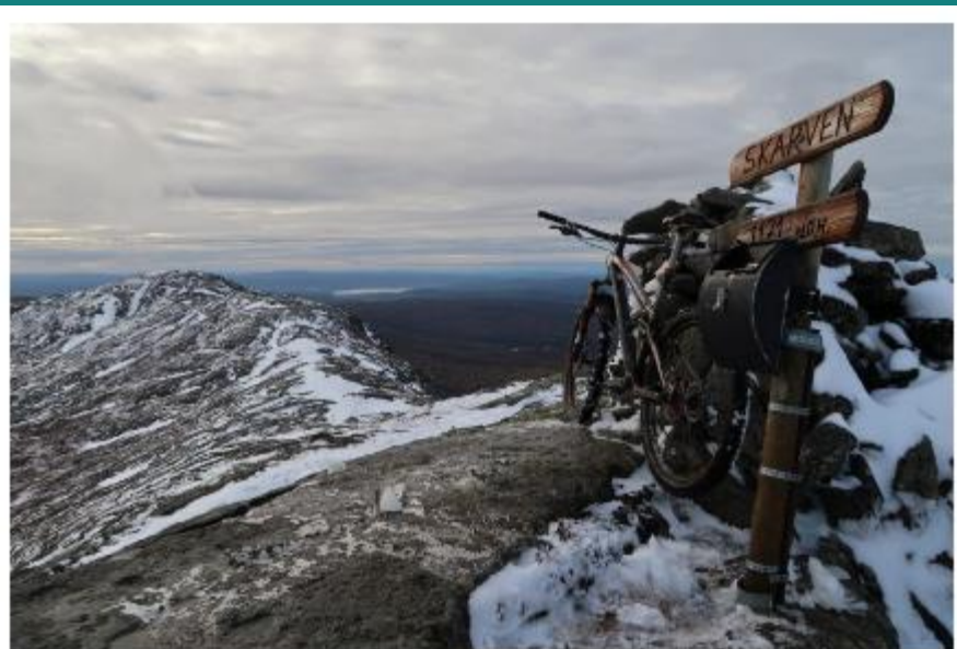
STORSKARVEN PÅ SYKKEL

BY MULTIADVENTURES | OCTOBER 20, 2018 | NO COMMENTS | FJELL, STISYKLING, SYLAN, TRØNDELAG