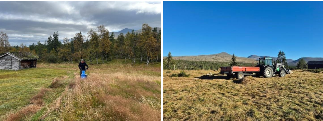
Bilde: 12 & 13 – Slått av setertrøer i Åkrådalen og i Horndalen.

De fleste setervollene innenfor Sølen LVO klassifiseres i dag som naturbeitemark, siden det er lenge siden de ble slått på tradisjonelt vis. Likevel er det flere av disse vollene som har et potensiale til å kunne omklassifiseres til slåttemark hvis man setter i gang riktig skjøtsel av dem. Det ble i 2023 kjøpt inn ei tohjuls slåmaskin for skjøtsel av gamle setervoller/slåttemark i henhold til tiltak foreslått i skjøtelsplanen. Sensommeren 2024 har vi i godt samarbeid med to setereiere slått to setertrøer med tohjuls slåmaskin, i Åkrådalen og i Horndalen, og graset ble raket sammen og fjernet.