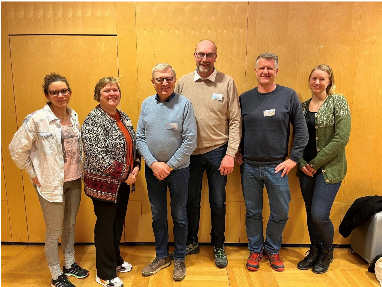
Bilde 1: Sølen verneområdestyre 2024-2027.