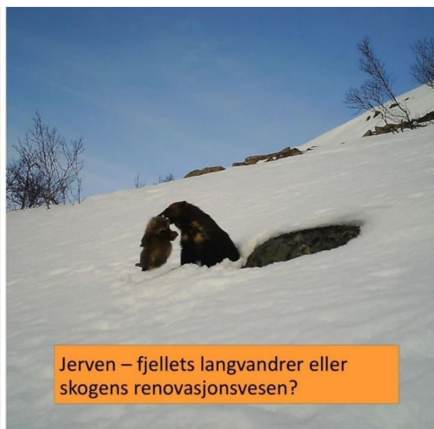
Bilde: 6 & 7: Temakveld hubro og jerv i juni.