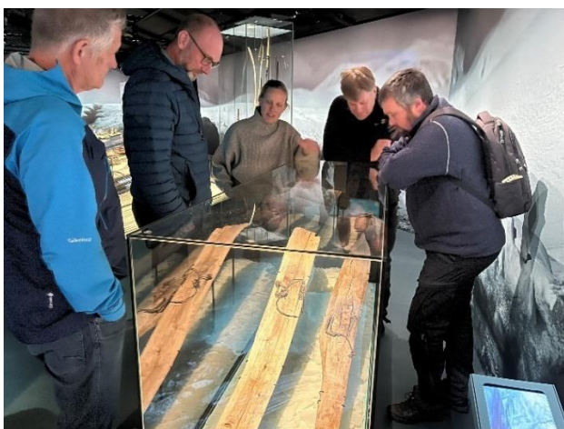
Bilde: 2 & 3 – Befaring innover fjellet i juni med besøk på Fiskevollen og i Åkrådalen.