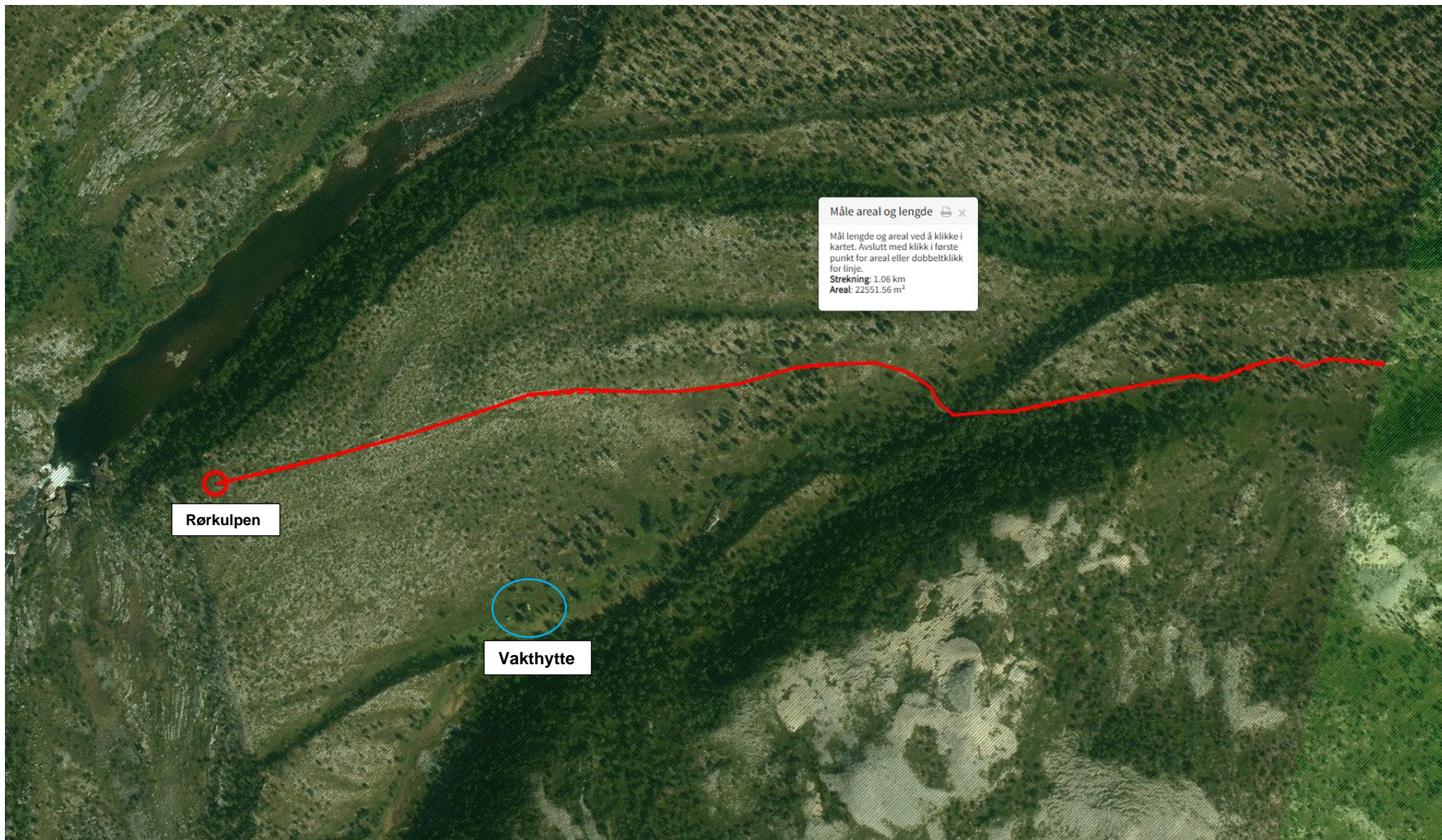
Kart over traseen som går til Fossekulpen i Stabbursdalen nasjonalpark (rød sirkel). Lengden på traseen i nasjonalparken er ca. 1 km fra grensen til landskapsvernområdet. Blå sirkel ringer rundt Stabbursdalen grunneierforening sin vakthytte.