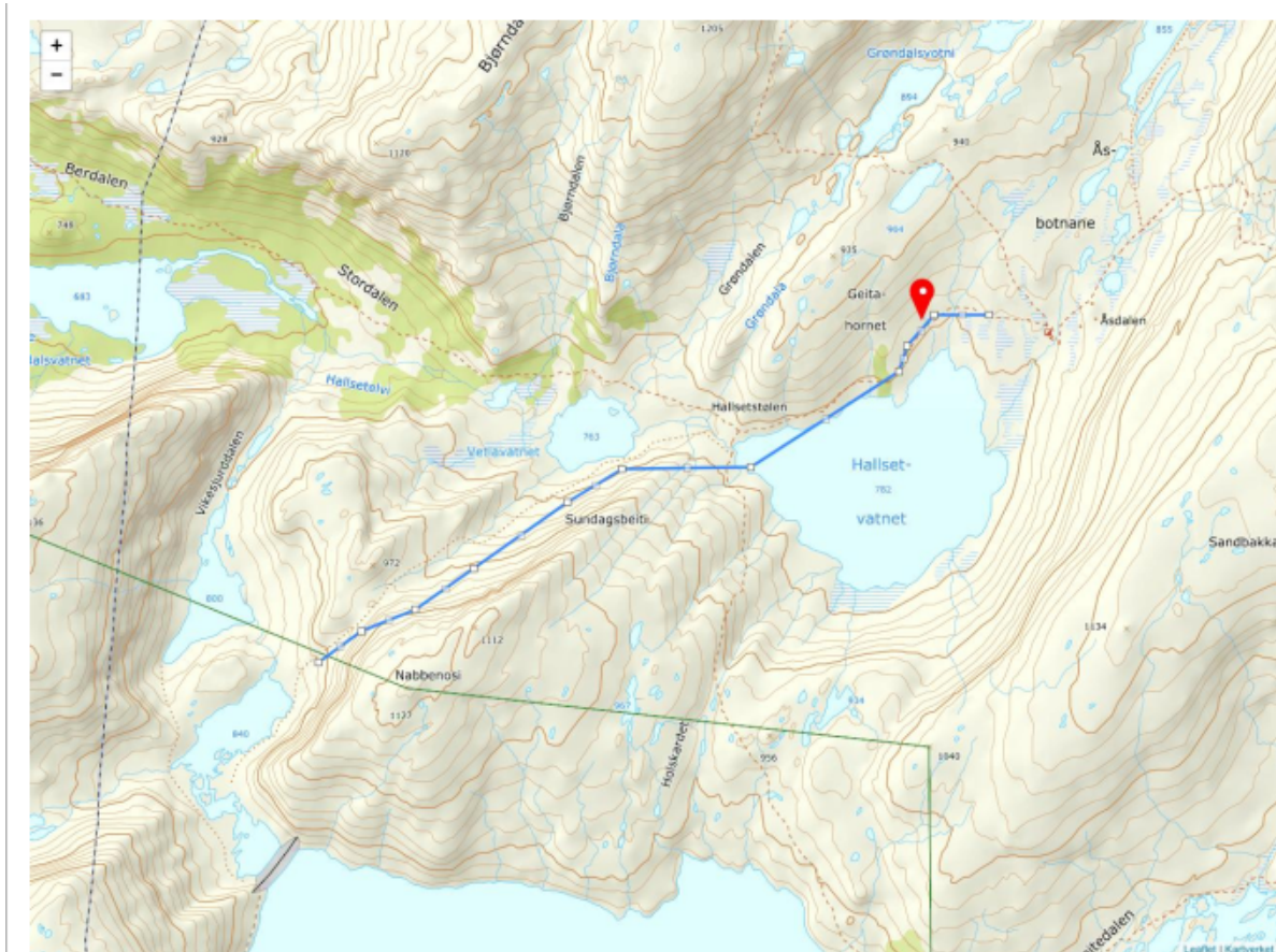
Figur 1 Kart med teikna flygeruta og landingsplass for helikopter. Raud markør er område med steinlegging. Kopi frå søknad.

Bergen og Hordaland Turlag søker om løyve til å transportera stein med helikopter frå Nabbaonosi til T-merkt sti mellom Åsedalen og Hallsetstølen. Stølsheimen verneområdestyre gav løyve til tiltaket i møte 09.06.2023. Steinen skal plukkast under Nabbanosi. Så langt det er mogleg, skal steinen plukkast utanfor vernegrensa til Stølsheimen landskapsvernområde.