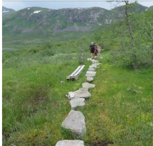
Tilrettelegging med stein og treklopper på stien mellom Steinslandstølen og Solrenningane.