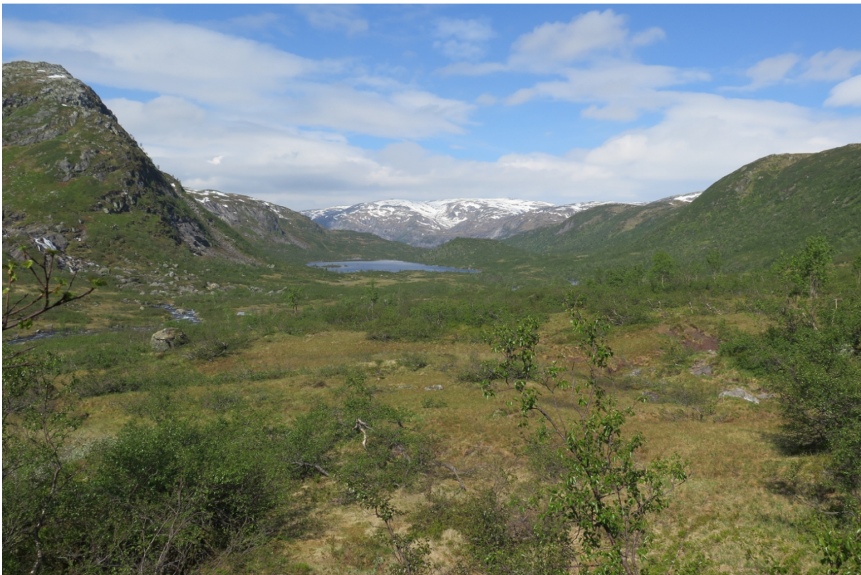
Parti frå myrområde i Berdalen.

Verneforskrifta opnar for merking av stiar, og i besøksstrategien for Stølsheimen er denne stien omtalt som sti som kan vurderast for tilrettelegging. I forvaltningsplanen står det at tilrettelegging for friluftsliv bør medføra minst mogleg fysiske inngrep og motorisert ferdsel.