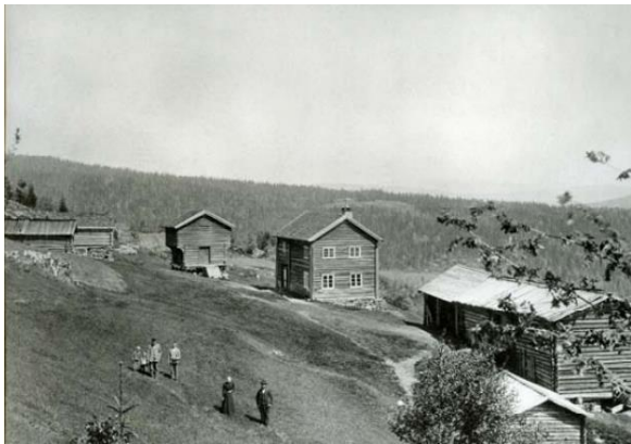
Øvre Fjøslien