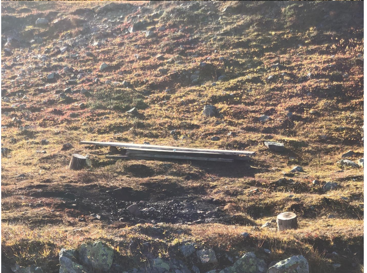
Bål plass etablert i det siste