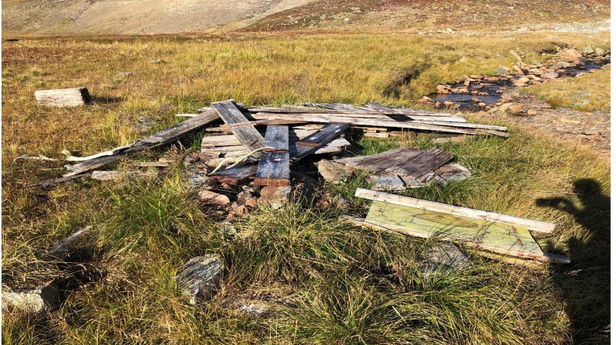
Rester av jaktleir